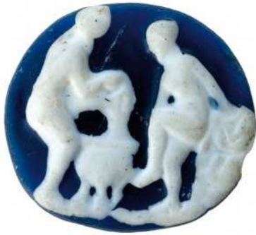
O baño de Venus, camafeo de imitación (s. II d.C.) Casa dos fornos (As Burgas). Museo Arqueolóxico de Ourense

O tema do baño de Venus-Afrodita, típico da época helenística, pode rastrexarse ao longo da historia da arte europea. Se te fixas un pouco atoparás os parecidos entre esta peza e esta pintura.