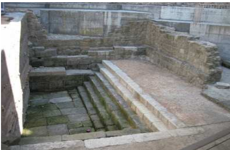
Piscina romana do santuario de Reve Anabaraego

“Como naceu a cidade de Ourense”, Prosas galegas , 1962.