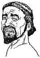
ὁ Δ. στενάζει