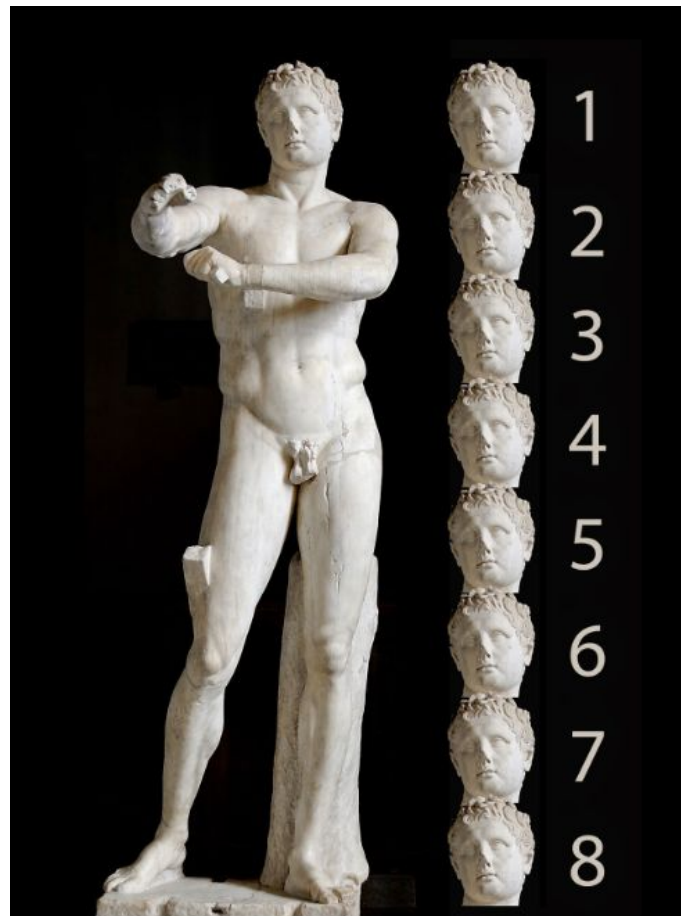
Canon de Lisipo