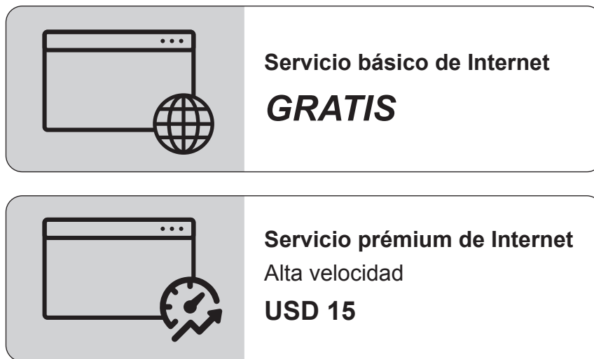
Figura 4: El servicio prémium propuesto por la Universidad EC

La Universidad EC está considerando la posibilidad de implantar un servicio prémium de Internet. Se trata de una suscripción de pago que ofrece al personal y a los estudiantes acceso completo al ancho de banda de su ISP (véase la Figura 4 ).