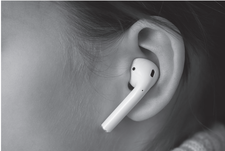
Figura 2: Un ejemplo de auriculares

Los auriculares Tekunoroji emiten un sonido que produce ecos característicos al desplazarse por el canal auditivo. Estos ecos son captados por un micrófono.