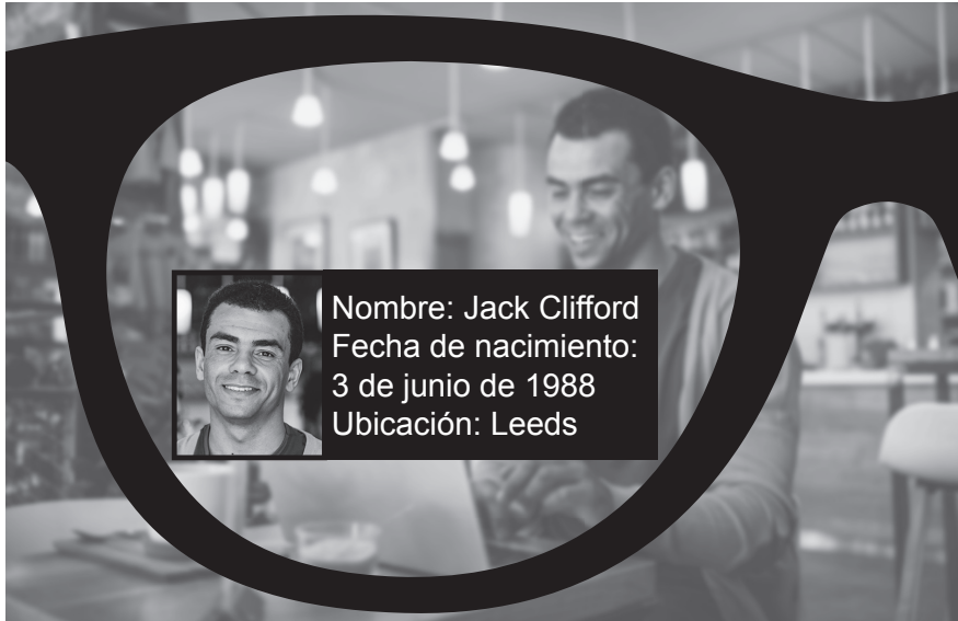
Figura 3: Ejemplo de gafas inteligentes

Los grupos de defensa de las libertades civiles están preocupados por el posible uso indebido de estas gafas inteligentes. Les preocupa que puedan utilizarse como una forma de vigilancia.