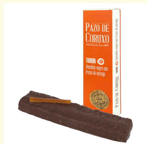
Turrón artesano de ganache de chocolate negro con naranja confitada 160g