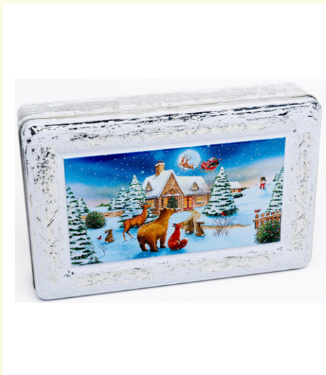
Lata paisaje navidad con 300g de bombón relleno de praline leche.