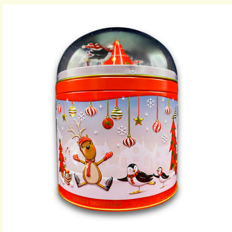
Lata metálica bola pingüino musical rellena de bombones praliné. 150gr.