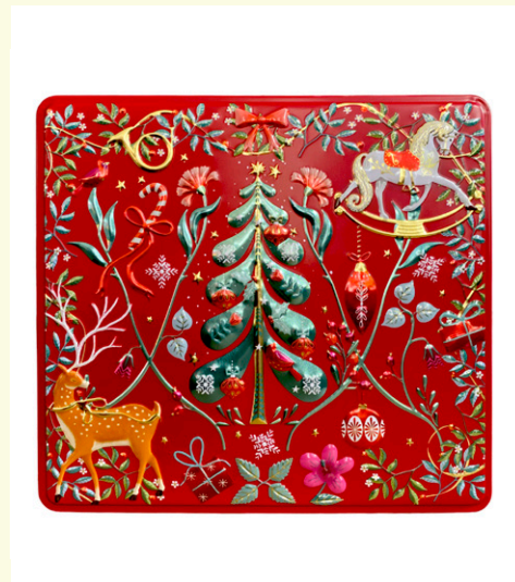
Lata ornamentos navidad 300g de bombón relleno de praline leche.