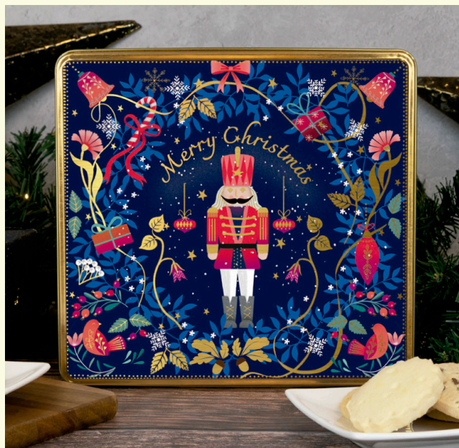
Lata navidad nutcracker 300g de bombón relleno de praline leche.