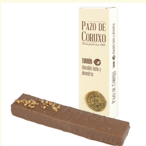
Turrón de chocolate leche con praline y almendra caramelizada 160g.