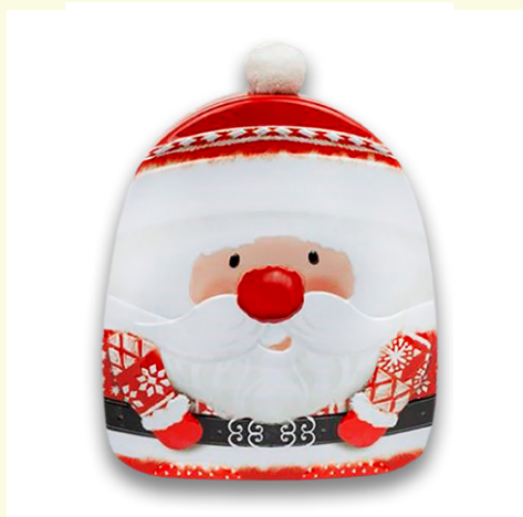
Lata metálica bobble hat Papa Noel rellena de bombones praliné. 150gr.