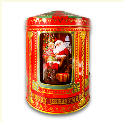
Lata metálica carrusel musical santa rellena de bombones praliné. 150 gr.