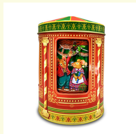
Lata metálica carrusel musical ratoncitos rellena de bombones praliné. 150 gr.