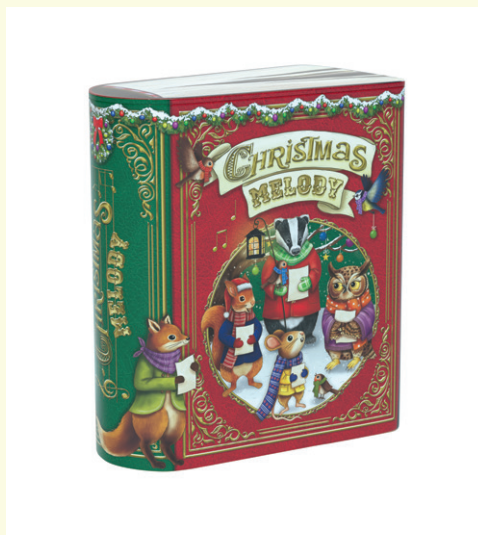
Lata metálica libro Melody rojo rellena de bombones praliné. 150gr.