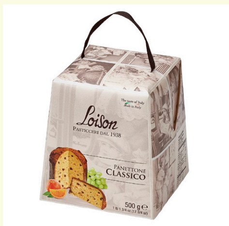
Panettone classico 500g. ( frutas confitadas)