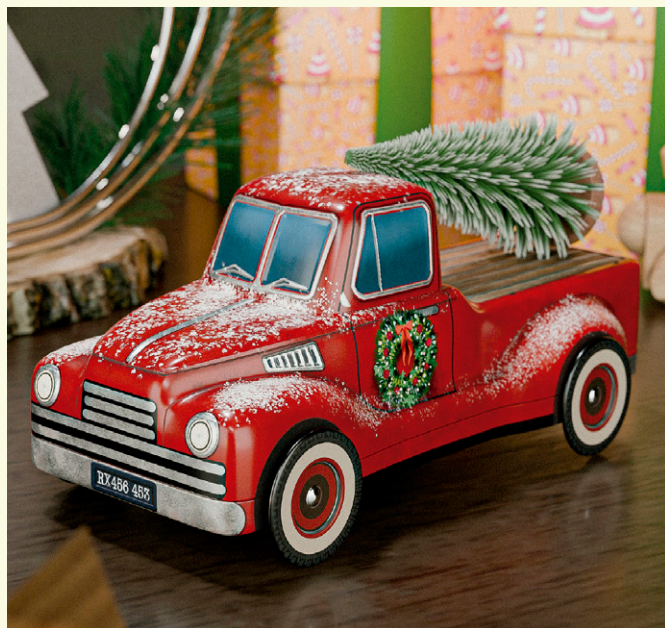
Lata coche navidad con arbol 150g de bombón relleno de praline leche.