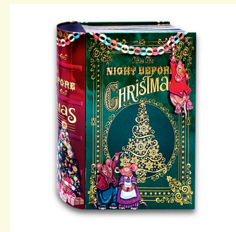
Lata metálica libro ratoncitos Navidad rellena de bombones praliné. 450 gr.