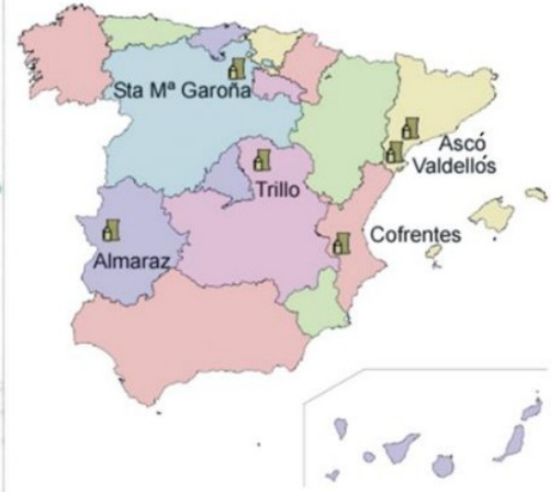
Figura 2. Centrais nucleares en funcionamento.