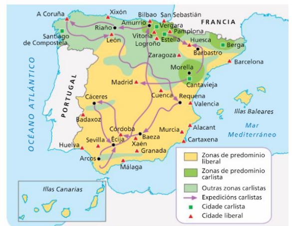
13. A PRIMEIRA GUERRA CARLISTA