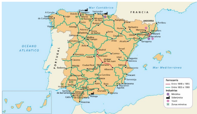
20. REDE FERROVIARIA E PRINCIPAIS INDUSTRIAS EN ESPAÑA