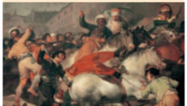
1. O dous de maio de 1808 en Madrid, obra de Goya.

B. PÉREZ GALDÓS, O 19 de marzo e o dous de maio Episodios Nacionais, 1873