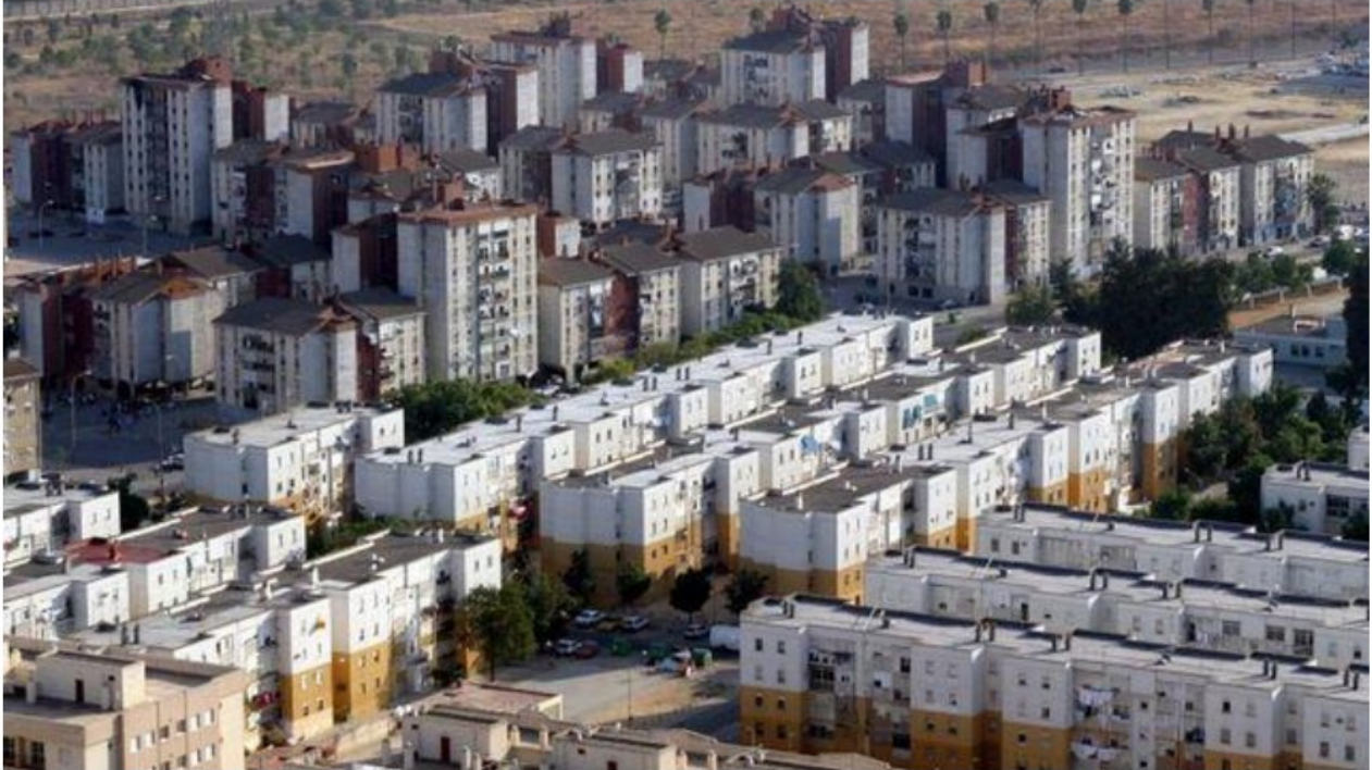
Figura 1. As Tres Mil Viviendas (Sevilla).