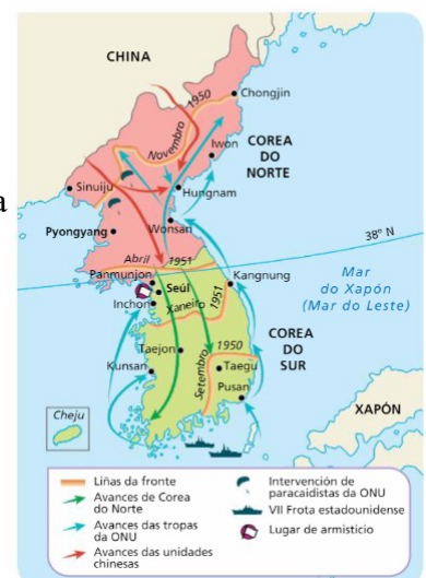
13. A GUERRA DE COREA

A coalición das Nacións Unidas, liderada por EEUU, emprendeu a reconquista de Corea do Sur e chegou a internarse no norte, preto da fronteira chinesa. Ante este feito, China anunciou o seu apoio a Corea do Norte .