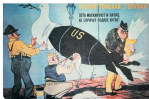
2. Caricatura soviética da Guerra Fría. Os estadounidense «disfrazan» unha bomba de pomba da paz.

- O desenvolvemento das actividades de espionaxe e os servizos secretos , a CIA e o KGB.