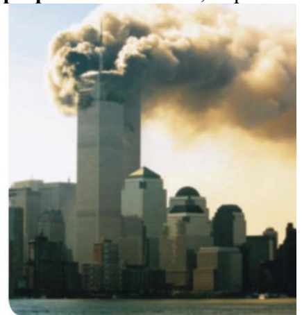
11. Atentado contra as torres xemelgas en Nova York o 11 de setembro de 2001.

A emerxencia de China , o fracaso das intervencións en Afganistán e Iraq, o rexurdir de Rusia e as accións unilaterais baixo a presidencia de George W. Bush provocaron un crecente sentimento antiestadounidense . A todo iso sumáronse os problemas económicos , o que dificultou a Estados Unidos o exercicio dunha hexemonía unilateral e global . O presidente Obama foi partidario de colaborar cos seus aliados .