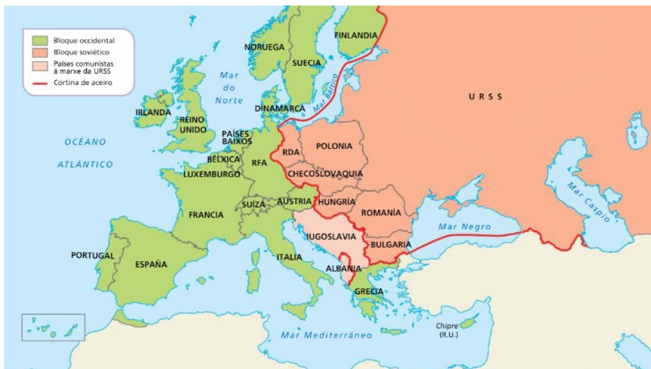
10. OS DOUS BLOQUES EN EUROPA EN 1953

- A Organización do Tratado do Atlántico Norte (OTAN). Asinouse en 1949 en Washington, que estableceu unha alianza militar defensiva contra calquera agresión ao mundo occidental. Inicialmente estivo integrada por Bélxica, Canadá, Dinamarca, EEUU, Francia, Islandia, Italia, Luxemburgo, Noruega, os Países Baixos, Portugal e o Reino Unido.