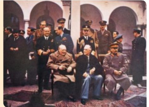
20. Churchill, Roosevelt e Stalin en Ialta.

Tamén se confirmou a anexión dos países bálticos e do leste de Polonia a URSS .