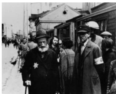
15. Gueto de Varsovia (Polonia).