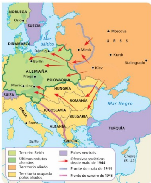
13. A GUERRA NA FRONTE ORIENTAL

No Pacífico, as forzas aliadas frearon o avance xaponés na batalla de Guadalcanal, en febreiro de 1943, e iniciaron un ataque coa táctica de "saltos de ra" do xeneral MacArthur. Esta táctica buscaba dous obxectivos: avanzar creando bases militares que á súa vez permitisen o seguinte «salto», e illar as bases inimigas que, sen subministracións, resultaban inoperantes.