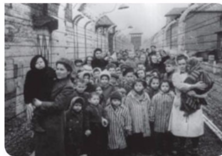
17. Campo de exterminio de Auschwitz-Birkenau (Polonia).