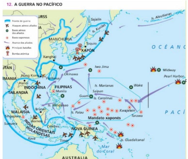
12. A GUERRA NO PACÍFICO