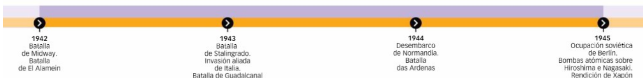
14. AS OFENSIVAS FINAIS ALIADAS (1942-1945)

Acabar axiña coa guerra para evitar baixas foi o argumento que deu o presidente estadounidense Harry Truman para ordenar o lanzamento de bombas atómicas sobre as cidades xaponesas de Hiroshima e Nagasaki en agosto de 1945. Xapón asinou a rendición incondicional o 2 de setembro. Concluía a Segunda Guerra Mundial.