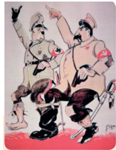
3. Caricatura do pacto xermano-soviético.

Moscova, 23 de agosto de 1939. Polo Goberno do Reich alemán, J. von RIBBENTROP. Plenipotenciario do Goberno da URSS, V. MOLOTOV