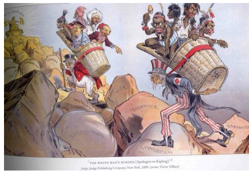
Factores ideolóxicos. John Bull (Gran Bretaña) y Tio Sam (EEUU) tiñan a misión de civilizar os pobos inferiores