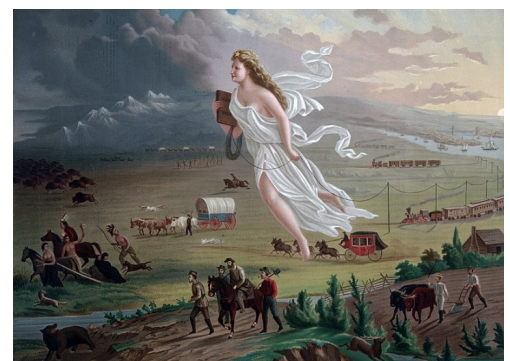
Destino manifesto (a figura alegórica de branco) acompaña os colonos brancos na súa conquista do oeste.