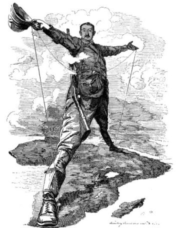
Imperio continuo. Gran Bretaña (Cecil Rhodes) buscaba unir nun único imperio África de norte a sur, do Cairo a o Cabo.