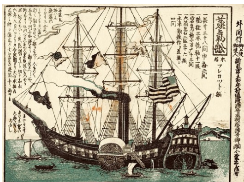
Os barcos negros. Enormes barcos a vapor dos EEUU se presentan nas costas xaponesas e obrígalles a abrir varios portos ao comercio internacional.