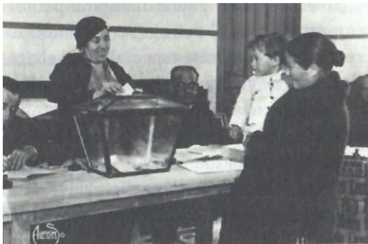
La compartida sonrisa –votante y presidenta– del primer voto. (19 de noviembre 1933).