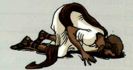
ōsculum -ī n