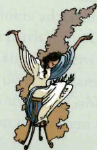
Pythia -ae f

cōnsilia deōrum = quod dii in animō habent