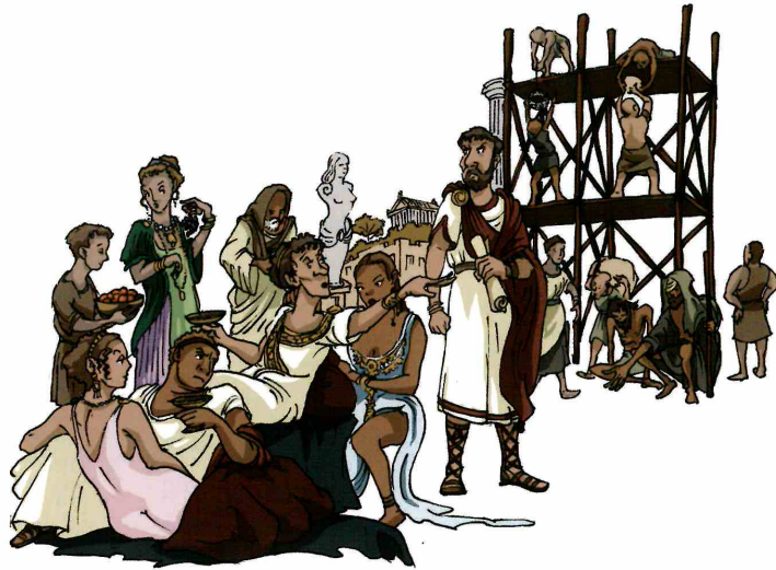
REGNVM FVNESTVM (I)

differre = nōn similis esse hic sg : Tarquinius ille sg : Servius