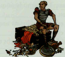
praeda -ae f