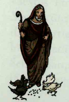
vātēs -is m/f