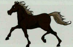
equus -ī m