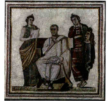
‘Labor omnia vicit improbus’ Vergilius, Georgicae I, 145

Mane enim patrōnī clientēs domum accipiunt: clientēs sunt libertī , id est, ōlim servī, qui patrōnōs salūtānt atque auxiliū ab iīs petunt. Patrōnī sunt nōbiles Rōmānī. Post salūtātiōnem patrōnī in forum conveniunt atque alia negōtia, pūblica et privāta, expediunt. Prope forum est basilica : Rōmānī in basilicam veniunt, sī iudicēs eōs in iūs vocant. Senātōrēs autem cūriam intrant, ubi dē bellō et pāce disputant.