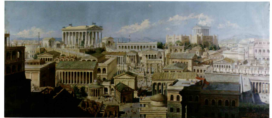
Cōnspectus Rōmae imperiālīs , Oreste Betti, 1906. Fondazione Cariplo, Mediolānī