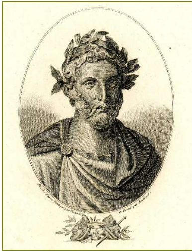
Titus Maccius Plautus (Sarsina, Umbría? Ca. 254 a.C.-184 a.C.)

Sabemos pouco da biografía de Plauto. As referencias bibliográficas que temos indican que naceu na Umbría (podemos supor o dominio da lingua umbra) e que foi escravo antes de triunfar como actor teatral.