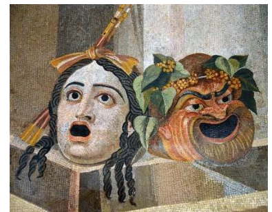
Mosaico do século II d.C. con dúas máscaras de comedia e traxedia.

A fabula togata tiña ambientación e vestimenta ( toga ) romanas, de trama moi simple, chea de elementos obscenos e sátira. Respéctase rigorosamente a escala social dos personaxes (o escravo nunca podería ser máis intelixente que o amo, por exemplo). Os principais representantes son Titinio, Afranio e Ata.