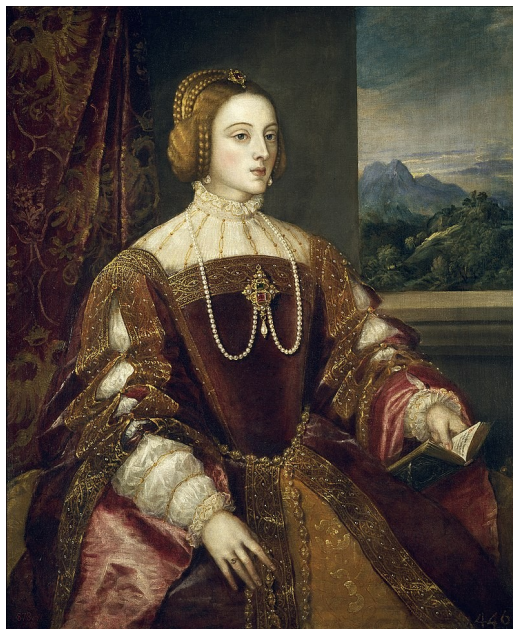
Retrato da emperatriz Isabel de Portugal (1503-1539) 1548. Museo do Prado (Tiziano. Dominio público).

Á súa volta xa como emperador, casa con Isabel de Portugal en 1526, que demostrará nas ausencias constantes do seu marido unha fina intelixencia política como rexente, ata a súa pronta morte en 1539. Logo deixará o seu fillo Filipe de rexente, o que lle dará moita práctica para cando asuma o reino.