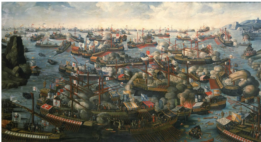
Batalla de Lepanto. National Maritime Museum (BHC0261). Dominio público.

Polo seu esforzo, Juan de Austria concedeu-lle catro escudos de vantaxe (premio militar).