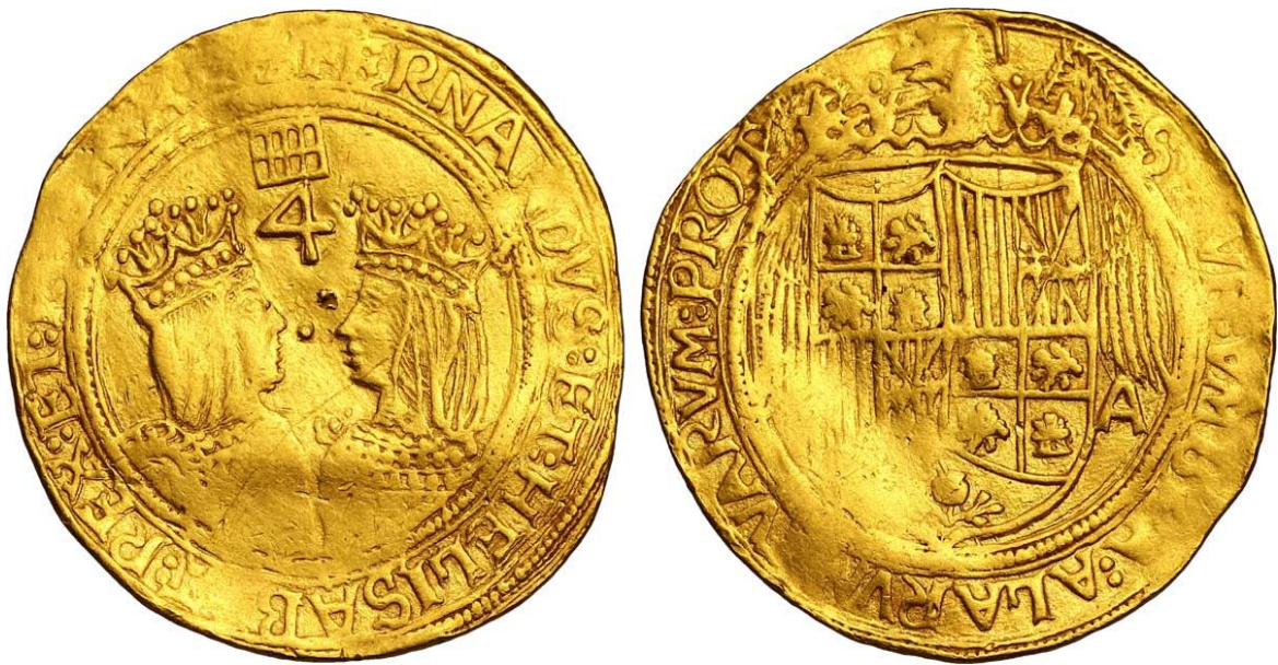
Cuádruplo ducado de ouro (CC BY-SA 3.0)