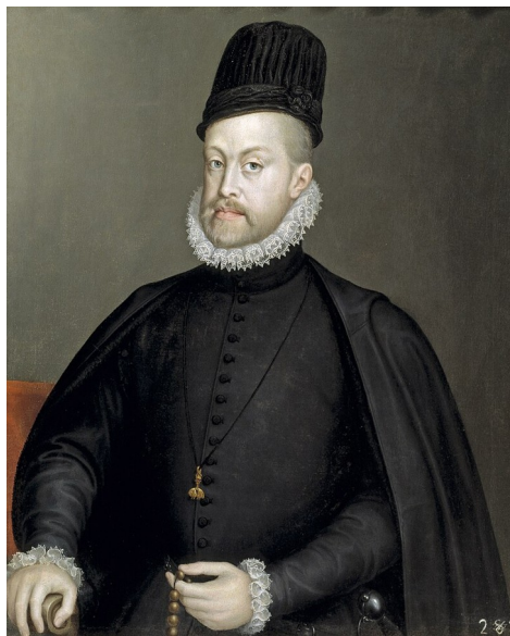
Retrato de Filipe II en 1565. Museo do Prado por (Sofonisba Anguissola. Dominio público).

Gobernou o seu imperio territorial desde Madrid, que converteu en capital do reino. Amplía os consellos e centraliza todo ao seu arredor cunha burocracia de funcionarios cada vez mellor organizada, pero coa súa desconfianza fai que sexa moi lenta.