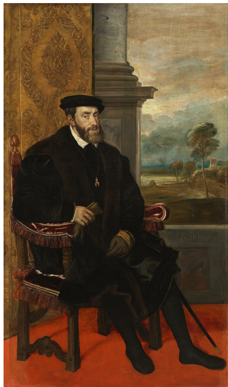
O Emperador Carlos V sentado en 1548 (atribuída a Tiziano. Dominio público).