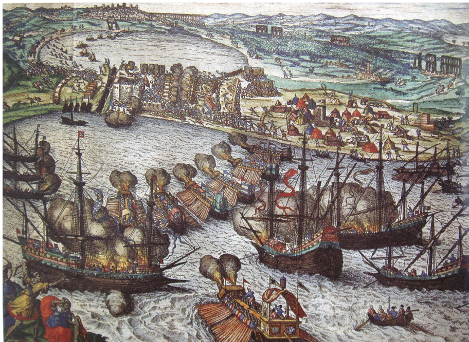
O Botafogo (á esquerda en primeiro plano) abrindo fogo contra La Goleta (Frans Hogenberg. Dominio público).