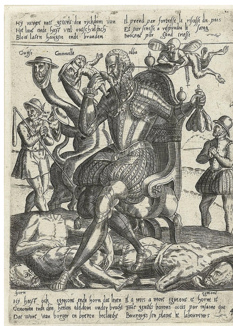
O Duque de Alba comendo nenos. Rijksmuseum Dominio público.