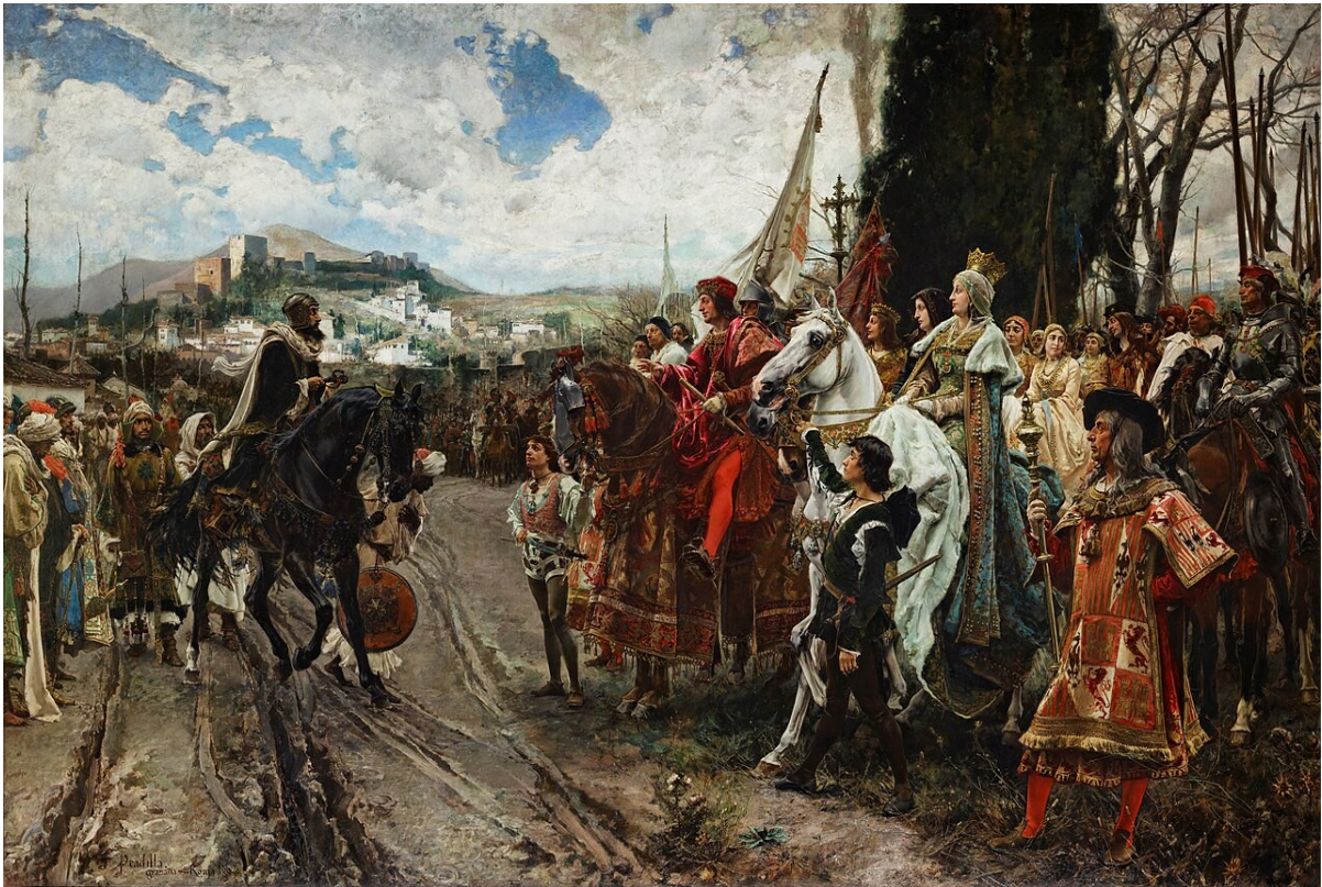
A obra representa o momento en que Boabdil, último rei nazarí, rendeu a cidade de Granada en 1492 e entregou as chaves aos reis católicos, Isabel I de Castela e Fernando II de Aragón.

A partir de aquí foi un proceso de expansión continua que culminarán os reis católicos no 1492 coa toma do Reino Nazarí de Granada.