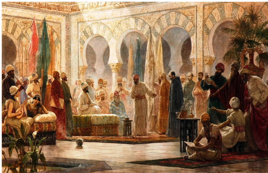
"A Corte de Abdal-Rahman III" (Dionisio Baixeras 1885. Public Domain)