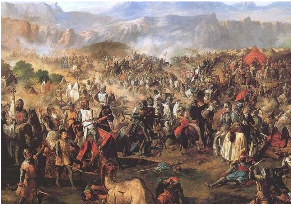
“Batalla das Navas de Tolosa (1212)”

Representa a batalla das Navas de Tolosa (16 de xullo de 1212), unha vitoria decisiva das forzas cristiás, lideradas polos monarcas Alfonso VIII de Castela, Pedro II de Aragón e Sancho VII de Navarra contra o exército do califa almohade Muhammad an-Nasir. A carga, en última instancia, de Alfonso VII e Sancho IV rompendo “as cadeas” da Garda Negra do califa posibilitou a vitoria. Dende ese momento, no escudo de Navarra, están representadas as cadeas, así como no de España.