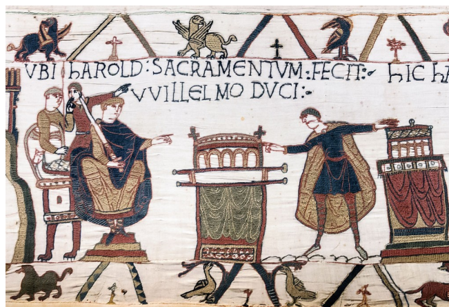
O rei Harold xura ante o duque Guillermo, ano 1070 (Creative Commons CC0 1.0 Universal)

Este proceso formalizábase a través da cerimonia da homenaxe .