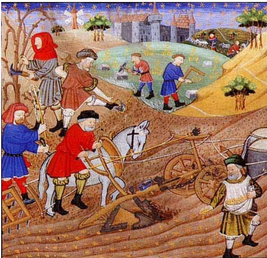
"Ilustración medieval que representa campesiños traballando a terra e aproveitando outros recursos como a madeira ou a pedra" (Gilles de Rome CC BY-SA 4.0).

O señor feudal tiña dereito de xurisdición sobre todas as terras do feudo e a cobrar tributos e polos servizos do feudo (pontes, muíños, fornos, etc).