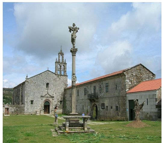
Mosteiro de Santa María do Aciveiro, Forcarei, Pontevedra

Temos mosteiros tan importantes coma o de Sobrado, Caaveiro, Samos, Montederramo, San Pedro de Rocas, A Armenteira ou O Carboeiro, entre moitos outros.