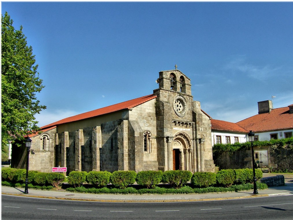
"Igrexa de Santa María de Cambre, A Coruña" (David Alonso Pérez. C C A-Share Alike 2.0 Generic license).

Dentro da arte románica destacará por riba de todo a arquitectura , a maior parte relixiosa, con igrexas, catedrais e mosteiros, e tamén edificios civís como castelos e hospitais.