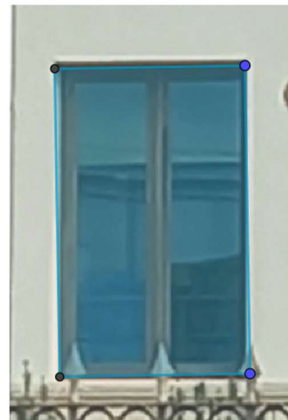
Rectángulo de Oro

Podemos estudiar diferentes arcos utilizando unas plantillas transparentes que nos permitan colocarlas sobre el arco a estudiar y ver así de que modelo se trata y como se construye, para ello imprimimos sobre un acetato o material similar la siguiente imagen de un arco ojival y un arco de medio punto: