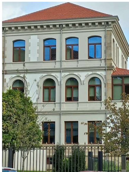
Edificio San Caetano- Santiago

Muchas veces en un mismo edificio encontramos varios modelos de arcos: