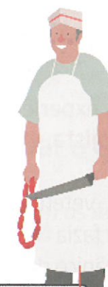
talhante / açougueiro(a) (br)