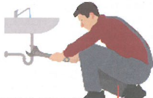
canalizador(a), picheleiro(a) / encanador(a) (br)