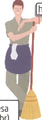
homem a dias / mulher a dias