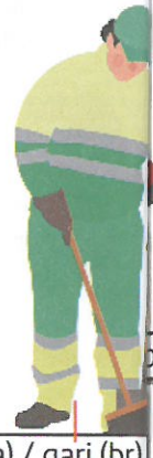
varredor(a) / gari (br)