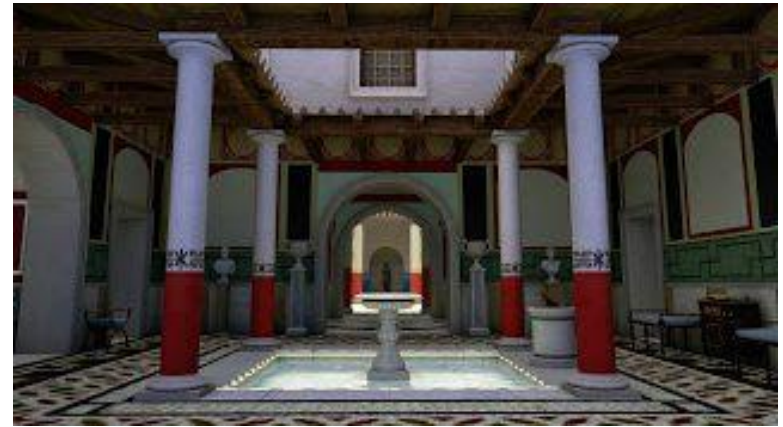
Reconstrución do interior do atrio dunha domus