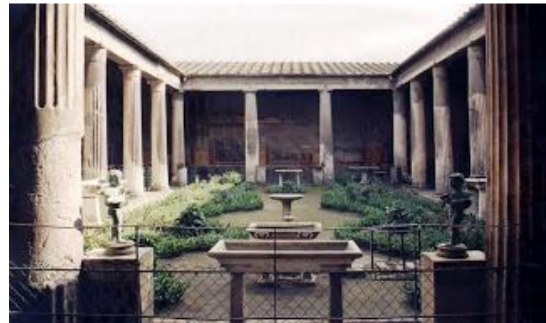
Casa dei Vetti , Pompeia