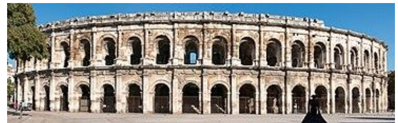
Anfiteatro de Nimes