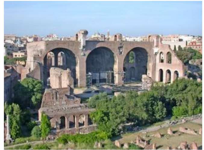
Basílica de Maxencio