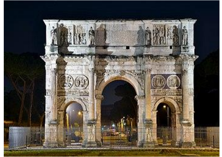
Arco de Constantino