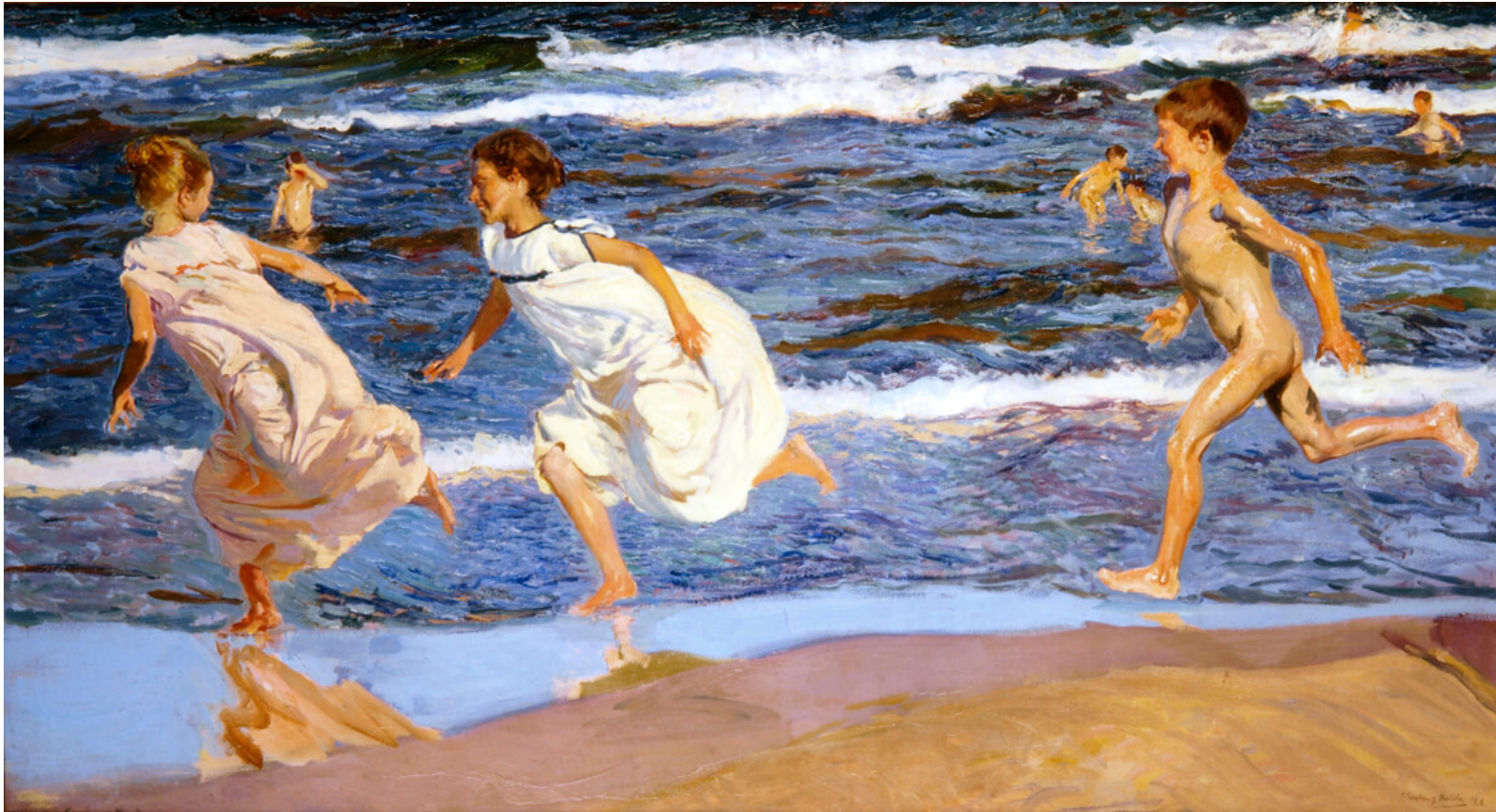
Corriendo por la playa, 1908. Joaquín Sorolla Óleo sobre lienzo