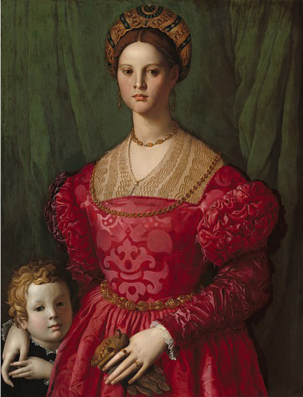
Agnolo Bronzino Mujer joven con su hijo Óleo sobre tabla, 1540