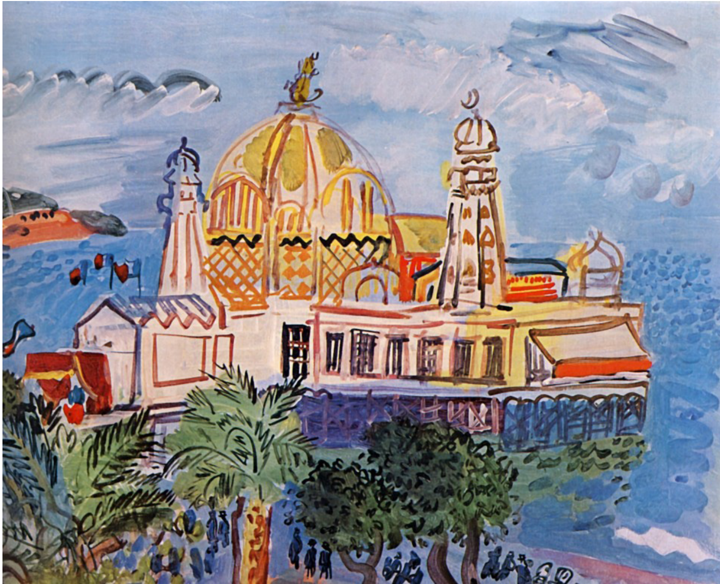
El casino de Niza, 1929. Raoul Dufy Óleo sobre lienzo