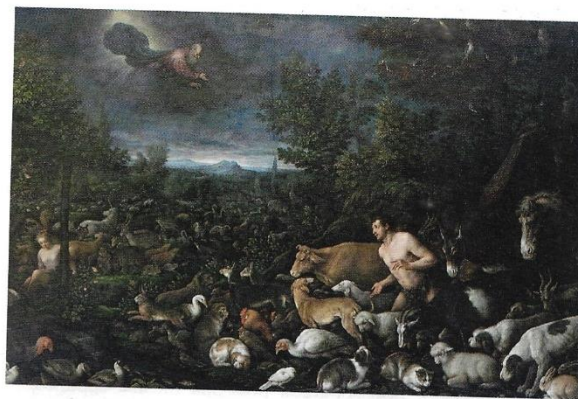
Deus existe por si mesmo, mentres que as cousas son creadas por el (Francesco Bassano, A reconvenção a Adán, Museo do Prado, Madrid).