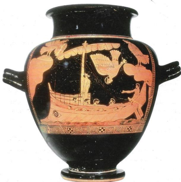
Na Antigüidade, os seres humanos pensaban que o destino gobernaba a súa vida (ánfora decorada con Ulises e as sereas, cerámica grega de figuras vermellas, século V a. C., British Museum, Londres).

Na época moderna, Leibniz e Kant falan dunha necesidade moral para indicar o carácter da lei moral, que obriga dunha forma categórica a todos os seres humanos.