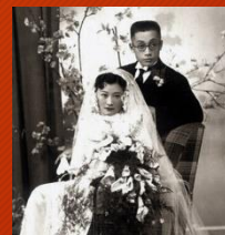
Pais dos pais do humano