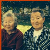
Pais do humano