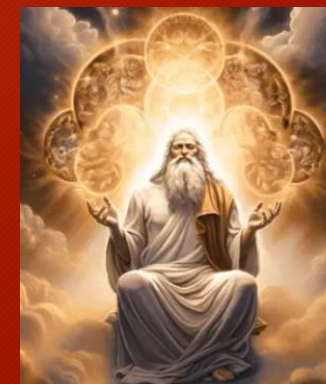
Primeira causa: Deus