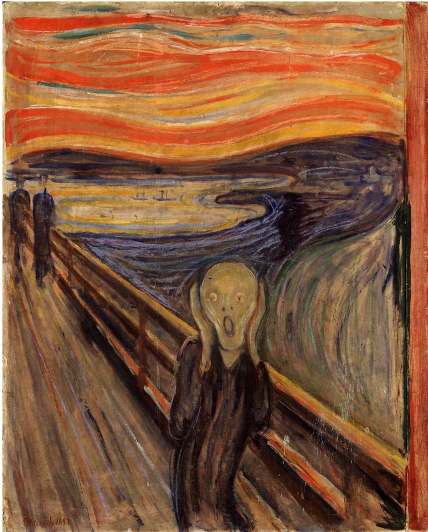
Autor: E. Munch Título: "El grito" Galería Nacional de Noruega

La función expresiva de una imagen está centrada en el emisor o emisora 2 , por lo que el objetivo que se pretende es expresarle al receptor o receptora sentimientos, ideas o sensaciones 3 .