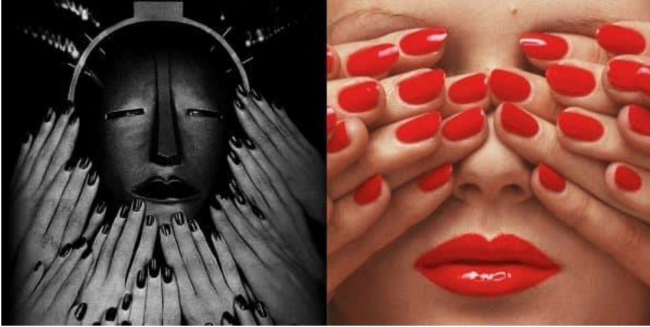
Man Ray (1932)

El visionario surrealista que pintaba con la luz