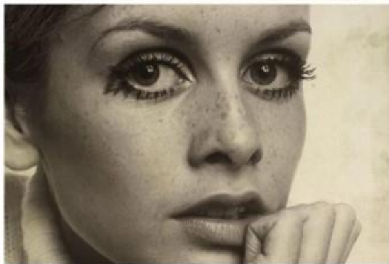
interpretación "Twiggy" Cecil Beaton