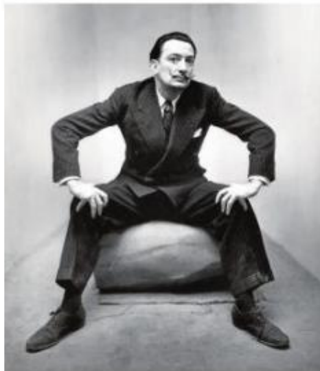
interpretación de "Retrato de Dalí" Irving Penn