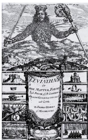
Ilustración 3. O leviatán (1651) de Thomas Hobbes.

Basicamente, na modernidade contempláronse dous modelos políticos opostos , froito tamén de dúas maneiras diferentes de entender os dous conceptos mencionados. Por un lado estaría Thomas Hobbes (1588-1679), que tratou de lexitimar a Monarquía absolutista e, por outro, John Locke (1632-1704), que na súa obra Tratados sobre o goberno civil vai propoñer un modelo de tipo democrático que actuará como expresión teórica do Estado liberal burgués.