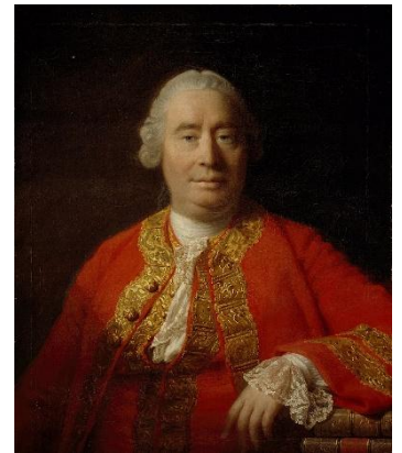
Ilustración 1. David Hume (1711 - 1776)

D avid Hume naceu o ano 1711 en Edimburgo, e alí morreu o ano 1776. As súas obras máis importantes son Tratado da natureza humana e Investigación sobre o entendemento humano . En ambos escritos continúa a dirección empirista da filosofía iniciada por Locke, só que levándoa ata as súas últimas consecuencias . Segundo Locke, non existe ningún coñecemento válido que non sexa derivado da experiencia , entendendo por experiencia toda a información que adquire a mente humana a través dos sentidos (vista, tacto, gusto, etc.) Aos contidos da mente así adquiridos chámalles Locke “ideas”.