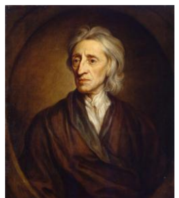
Ilustración 2. John Locke (1632 - 1704)

Desde o punto de vista filosófico é considerado o pai do Empirismo Inglés , corrente que nace como oposición ao racionalismo desenvolvido no continente por Descartes, Spinoza e Leibniz. As principais obras de Locke son Carta sobre a tolerancia (1689), Dous tratados sobre o goberno (1690), Ensaio sobre o entendemento humano (1690) e A racionalidade do cristianismo exposta conforme á Escritura (1695).