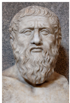
Platón (427 – 347 a.C.)

-Deixemos, pois, definidas estas dúas especies que se dan na alma.