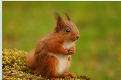
Selección natural Orixe: Necesidade