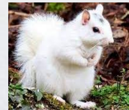
Mutación: Cor Orixe: Azar