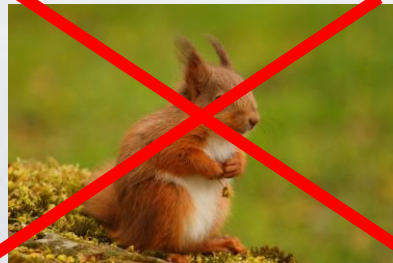
Selección natural Orixe: Necesidade