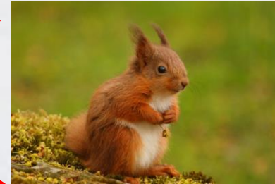
Mutación: Pelo Orixe: Azar