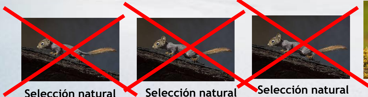
Selección natural Orixe: Necesidade