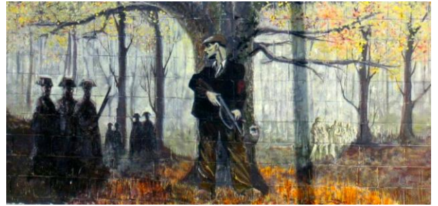
Grafiti en un muro de Sallent de Llobregat, rememorando a los maquis españoles.

En Madrid habría gente que creería que en 1939 se había acabado la guerra, pero en mi pueblo todo era distinto. En mi pueblo los hombres se echaban al monte para salvar la vida, y la autoridad perseguía a las mujeres que intentaban ganársela con la recova, a las que recogían esparto en el monte, a las que trabajaban y hasta a las que vendían espárragos silvestres por las carreteras, porque para ellas todo estaba prohibido, todo era ilegal, todo un delito y la supervivencia de sus hijos un milagro improbable.