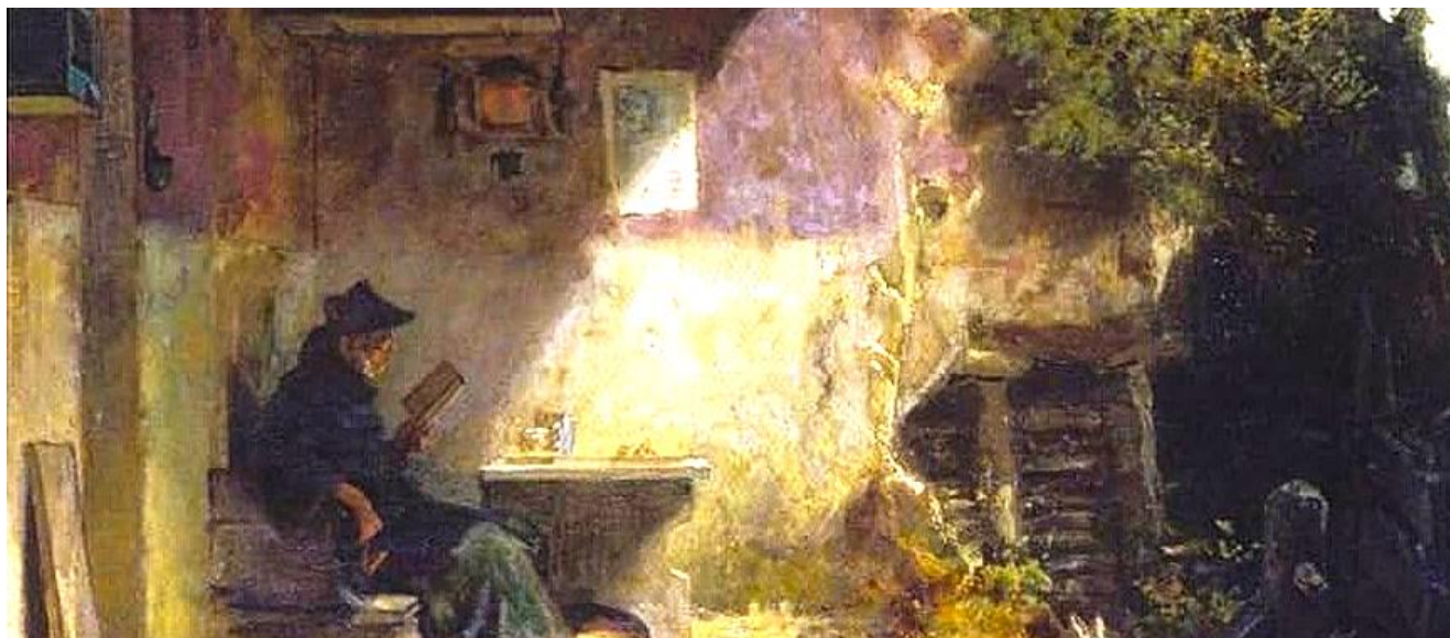
Carl Spitzweg: El ermitaño frente a su retiro . (Incompleto)

► Desde mediados siglo, se presta especial atención a la espiritualidad . A ello responde el desarrollo de la ascética , que, para alcanzar a Dios, propone la práctica una vida virtuosa ( vir iustus ), compatible con el estoicismo del latino Horacio. Sus odas fueron seguidas muy de cerca por Fray Luis de León en las suyas, en que se defiende el dominio del alma mediante el estudio, la austeridad ( aurea mediocritas ), el retiro del fragor mundano y el contacto con la naturaleza ( beatus ille ), tópicos reelaborados por la variante castellana menosprecio de corte y alabanza de aldea , ponderación de la vida campestre frente al lujo cortesano. No falta tampoco la advertencia sobre el escaso valor y la transitoriedad de lo terrenal ( vanitas vanitatis y ubi sunt ).