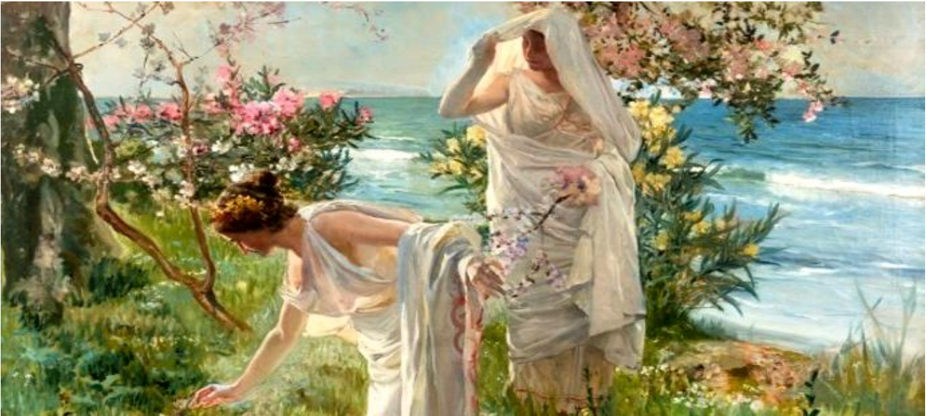
Sorolla: Muchachas griegas en la orilla. (Incompleto)

Pese a la brevedad de su obra – destacada por los sonetos y las églogas (poemas pastoriles) –, Garcilaso de la Vega – prototípico caballero renacentista formado en artes y guerra – impone, a partir de 1526, una completa renovación del lenguaje poético con la recreación – imitatio – de formas y asuntos de los clásicos grecolatinos y de la lírica italianizante en boga.