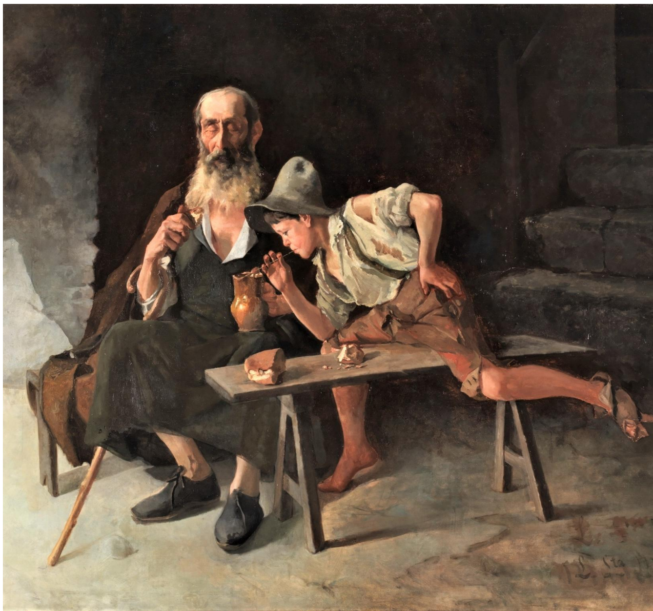
Luis Santamaría y Pizarro (1887): El Lazarillo de Tormes .

🍏 La novela picaresca , punto de partida de la novela moderna, surge en España con la publicación en 1554 del anónimo Lazarillo de Tormes , que sienta las bases del género. El enfoque de este tipo de narraciones es realista , puesto que efectúan un crítico retrato de la sociedad coetánea a través del relato en primera persona de un pícaro, personaje de origen marginal que practicaba toda clase de tretas para subsistir y rendía servicio a varios amos en su afán de ascender en la escala social. En el Lazarillo , en concreto, la crítica se centra en el clero y el concepto de honra ligada al nacimiento, a la que – por consiguiente – no podía aspirar un personaje como Lázaro.