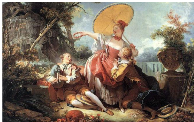
Jean-Honoré Fragonard: El concurso musical, 1755

Era un aire suave de pausados giros; el hada Harmonía, ritmaba sus vuelos, e iban frases vagas y tenues suspiros entre los sollozos y los violoncelos. [...] 5