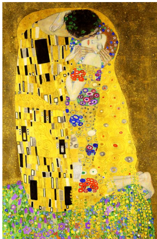
Gustav Klimt: El beso .

En una noche oscura, con ansias en amores inflamada, (¡oh dichosa ventura!) salí sin ser notada, estando ya mi casa sosegada. [...] 5