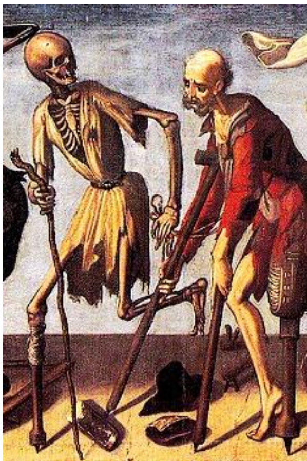
Ilustración de Víctor G. Ambrus

Recuerde el alma dormida, avive el seso y despierte contemplando cómo se pasa la vida, cómo se viene la muerte 5 tan callando; cuán presto se va el placer; cómo después de acordado da dolor; cómo a nuestro parecer 10 cualquiera tiempo pasado fue mejor.