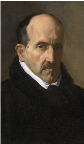
Luis de Góngora retratado por Velázquez