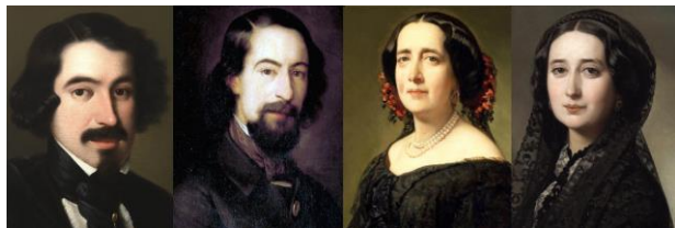
De izquierda a derecha: Espronceda (1842-46) y Zorrilla (1846) por Antonio María Esquivel; Gertrudis Gómez de Avellaneda (1857) y Carolina Colorado (1855) por Federico de Madrazo

■ Uno de los exponentes de la lírica durante la fase de apogeo romántico fue, sin lugar a dudas, el ya citado