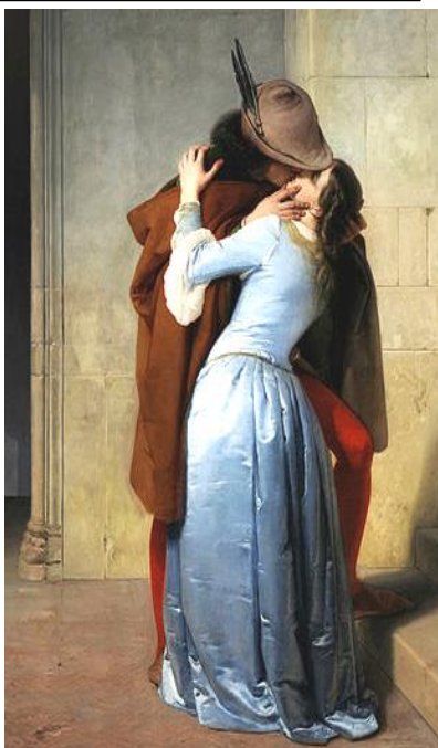
Francesco Hayez (1859): El beso