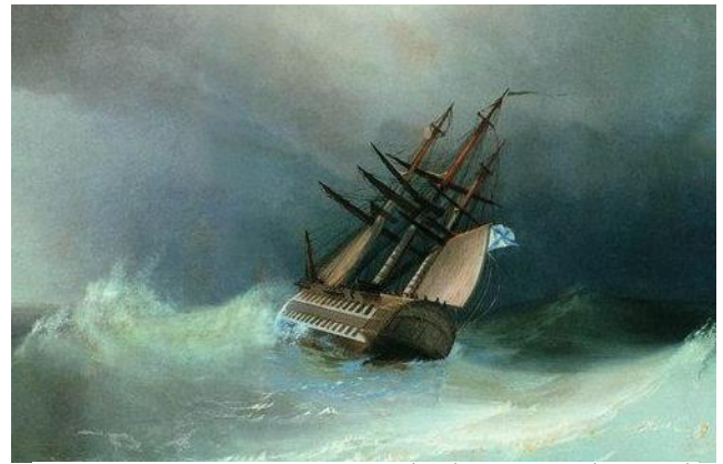
Ivan Aivazovsky (1851): La tempestad (incompleto)

■ En lo que atañe a los géneros , la fabulación a la que tiende el Romanticismo lo hace pródigo en leyendas y relatos fantásticos y/o terroríficos; su fascinación patriótica condujo a un gran desarrollo de la novela histórica , junto con la literatura costumbrista en artículos periodísticos y cuadros de costumbres ; el teatro vivió una época de éxito apabullante con melodramas muy efectistas ; y la apuesta por la emoción y los sentimientos llevó a la recuperación de la lírica .