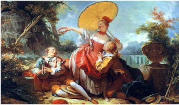
Jean-Honoré Fragonard (1755). El concurso musical