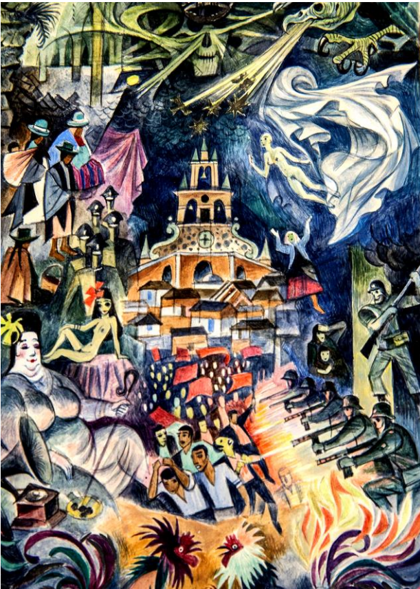
Imagen del diploma del Premio Nobel de literatura de G. García Márquez en 1982