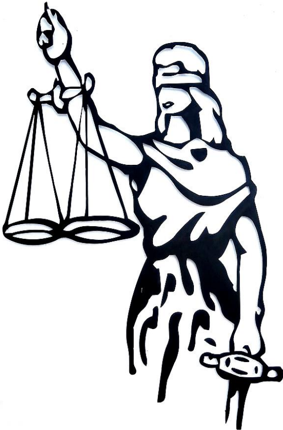
Alegoría de la Justicia (2019) Creative Commons Attribution.

■ Figuras semánticas. Juegan con los significados de palabras y expresiones.