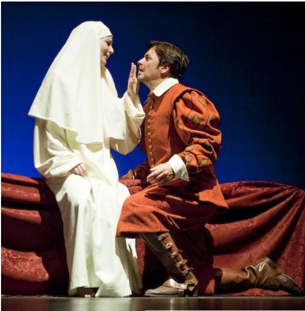
Representación del Don Juan Tenorio , de Zorrilla en el teatro clásico de Sevilla el día de Difuntos de 2005

■ El género dramático , también llamado teatral, engloba todas las obras concebidas para la representación en escena ante un público.