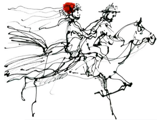
Imagen que ilustra una de las escenas de Bodas de Sangre , de F. G. Lorca

La otra parte del texto dramático se corresponde con las acotaciones que, escritas entre paréntesis y en cursiva, son las indicaciones del autor sobre la representación de elementos no verbales: decorado y colocación de sus elementos; indumentaria, posición, movimientos y gestos de los actores; reproducción de sonidos y/o música... Y es que el teatro, además de un hecho literario, es también un espectáculo en el que intervienen multitud de códigos.