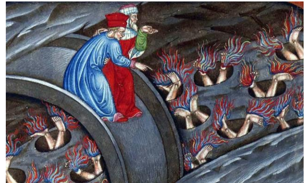
Condenados por simonía en la Divina Comedia de Dante. Miniatura lombarda (C.1430-1450)

► Elementos de la narración. [Para el estudio de los elementos de la narración véase el apartado correspondiente en la unidad dedicada a las Modalidades discursivas]