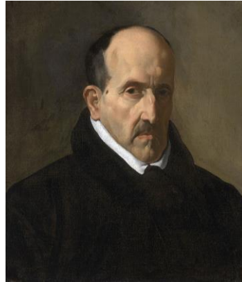
Luis de Góngora retratado por Velázquez