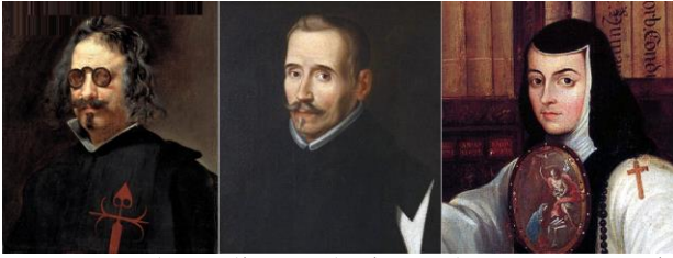
Quevedo, por Velázquez (atribución). Lope de Vega, por Eugenio Cajés. Sor Juana Inés de la Cruz, por Miguel Cabrera

► Francisco de Quevedo y Villegas es el máximo exponente de la lírica conceptista. Su obra, recopilada en Parnaso español y Las tres musas últimas castellanas , está compuesta tanto en metros populares como en versificación culta, y toca prácticamente todos los asuntos y preocupaciones de la época. Emblema del multiforme barroco, este genio fue capaz tanto de las más trascendentes reflexiones políticas y filosóficas , atravesadas por la obsesiva idea del rápido paso del tiempo y sus nefastas consecuencias (así en Miré los muros de la patria mía ); como de un mordaz y aniquilador escarnio en poemas satíricos y burlescos – como el ataque a Góngora del soneto Érase un hombre a una nariz pegado o la crítica al poder del dinero en la letrilla Poderoso caballero es don dinero –, que son, sin duda, precedente del esperpento de Valle-Inclán. Pero también de las concepciones amorosas más sublimes, vertidas en monumentos como el celeberrimo y eternamente aplaudido soneto Amor constante más allá de la muerte , en que el primero erige sobre la segunda su victoria.