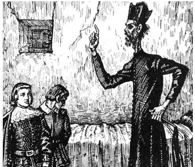
Ilustración Historia de la vida del Buscón (1941). Biblioteca Nacional, Madrid