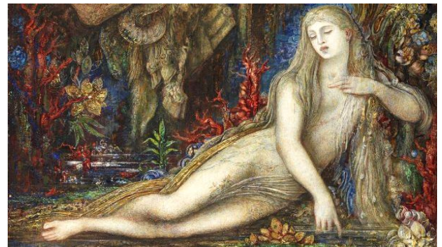
Gustave Moreau (hacia 1896): Galatea

En su Fábula de Polifemo y Galatea , a que aludiremos más abajo, Góngora describe de la siguiente manera a la ninfa, desnuda al amanecer: