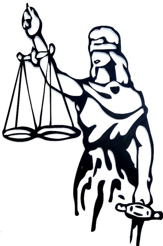
Alegoría de la Justicia (2019) Creative Commons Attribution.

■ Figuras semánticas. Juegan con los significados de palabras y expresiones.