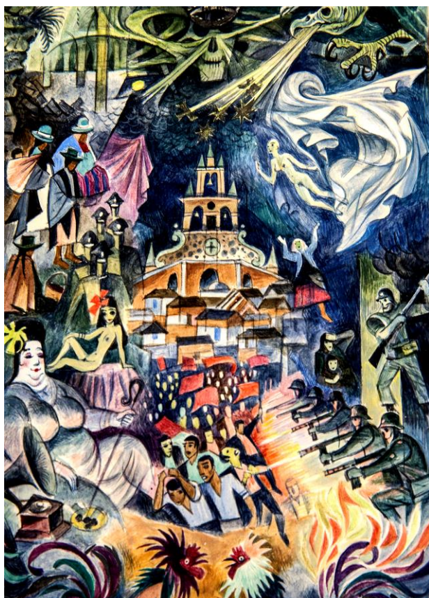
Imagen del diploma del Premio Nobel de literatura de G. García Márquez en 1982