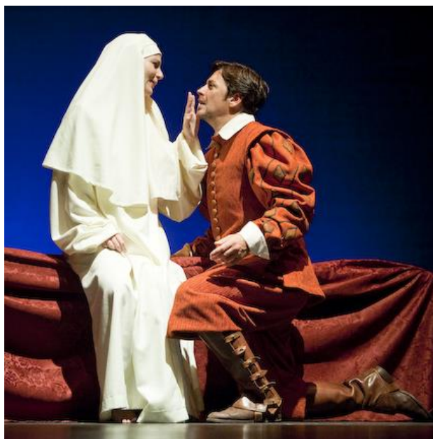
Representación del Don Juan Tenorio , de Zorrilla en el teatro clásico de Sevilla el día de Difuntos de 2005

■ El género dramático , también llamado teatral, engloba todas las obras cuya historia ha sido concebida para la representación en escena ante un público.