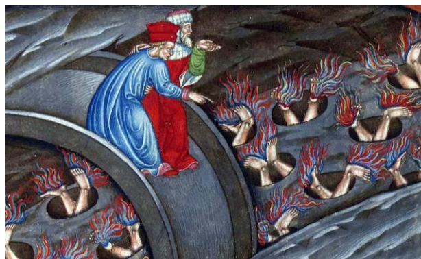
Condenados por simonía en la Divina Comedia de Dante. Miniatura lombarda (C.1430-1450)

► Elementos de la narración. [Para el estudio de los elementos de la narración véase el apartado correspondiente en la unidad dedicada a las Modalidades discursivas]