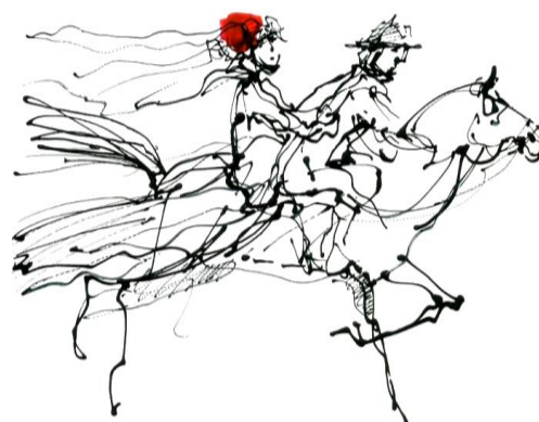
Imagen que ilustra una de las escenas de Bodas de Sangre , de F. G. Lorca

La otra parte del texto dramático se corresponde con las acotaciones , escritas entre paréntesis y en cursiva: son las indicaciones del autor sobre la representación de elementos no verbales: tipo de decorado y colocación de sus elementos; indumentaria, posición, movimientos y gestos de los actores; reproducción de sonidos y/o música... Y es que el teatro no es solo un hecho literario, es también un espectáculo en que intervienen multitud de códigos además del lingüístico.