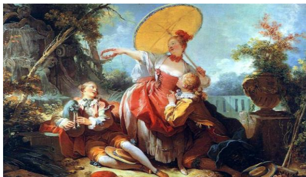
Jean-Honoré Fragonard (1755). El concurso musical