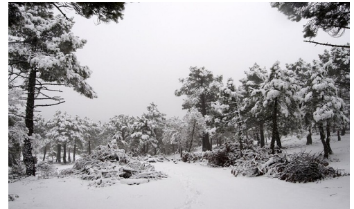
Nieve, nieve... (José Ibáñez, CC BY-3.0)

Ej: caía una fría nieve sobre París. El adjetivo fría no distingue una nieve de otras, sino que "explica" cómo es la nieve poniendo de relieve una cualidad suya (toda nieve es fría).