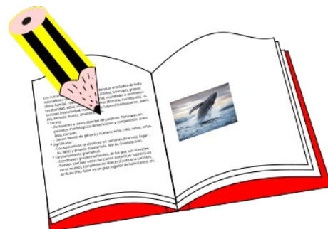
Lengua para la wikimedia (1516TicoCarlosSerrano CC-BY-SA 4.0)

Los sustantivos sirven para nombrar todas las cosas que nos rodean, desde personas (madre, Pedro) y animales (gato, delfín) hasta objetos (mesa, lápiz), lugares (campo, parque), ideas (belleza, justicia) y sentimientos (alegría, amor).