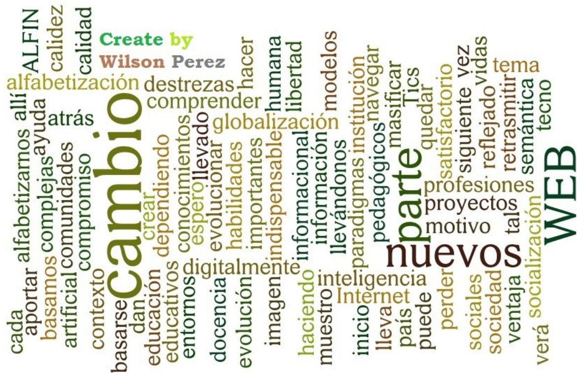
Nube 2