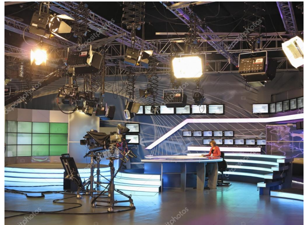
Estudo de televisión

3. a A posproducción encárgase de dar unidade ao programa editando as mellores tomas, para a súa versión definitiva. Por último, realízanse varias copias da gravación, para a súa emisión e conservación en arquivo.