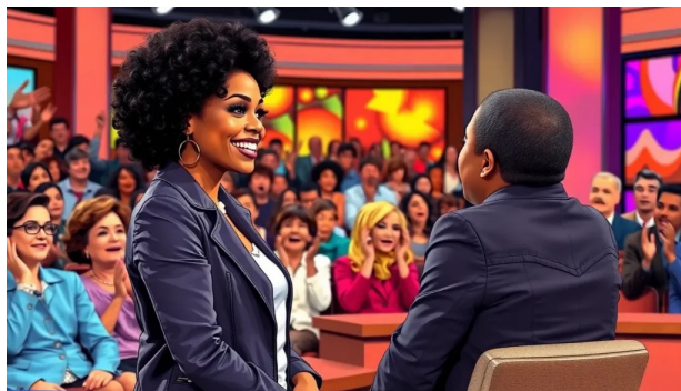
Imaxe dun reality show

O sentimento e a emoción, dous dos ganchos dos talk Shows, apelan á identificación entre o espectador e os personaxes que aparecen no programa, conseguindo desta maneira un dos obxectivos televisivos, aumentar a aceptación e a difelidade ao programa.