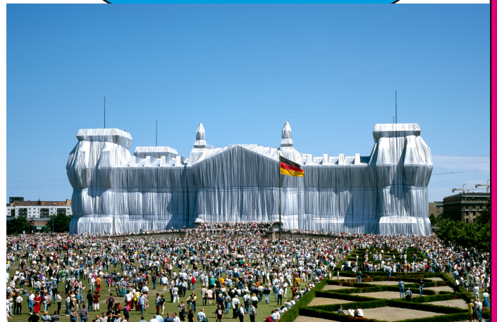
Christo Javacheff: Reichstag envolto , 1995. Berlín.