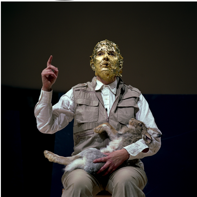
Marina Abramovic: Homenaxe a Joseph Beuys (performance) , 2005. Museo Guggenheim, Nova York.