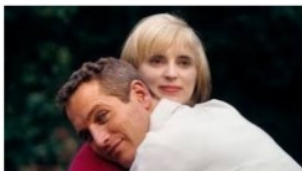
Figura 3: Intercambio da cara da muller de Paul Newman