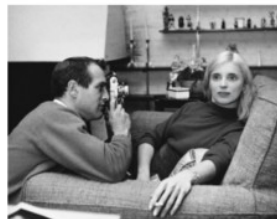
Figura 1: Vídeo cantando