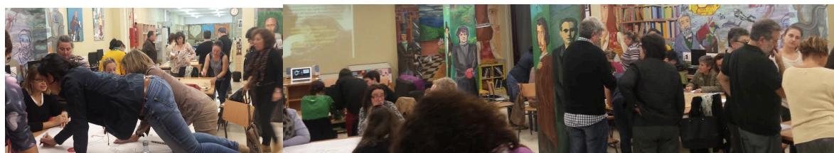
Curso de formación. Biblioteca escolar. Proxectos lectores