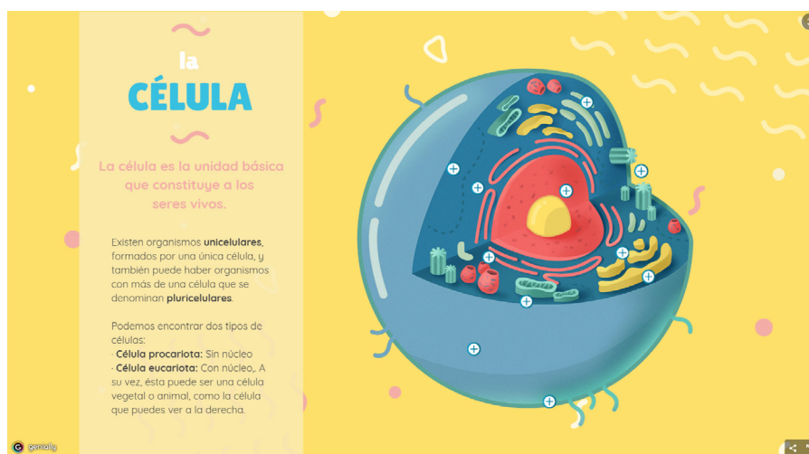
Imagen 1. Ejemplo de presentación interactiva. Enlace a página