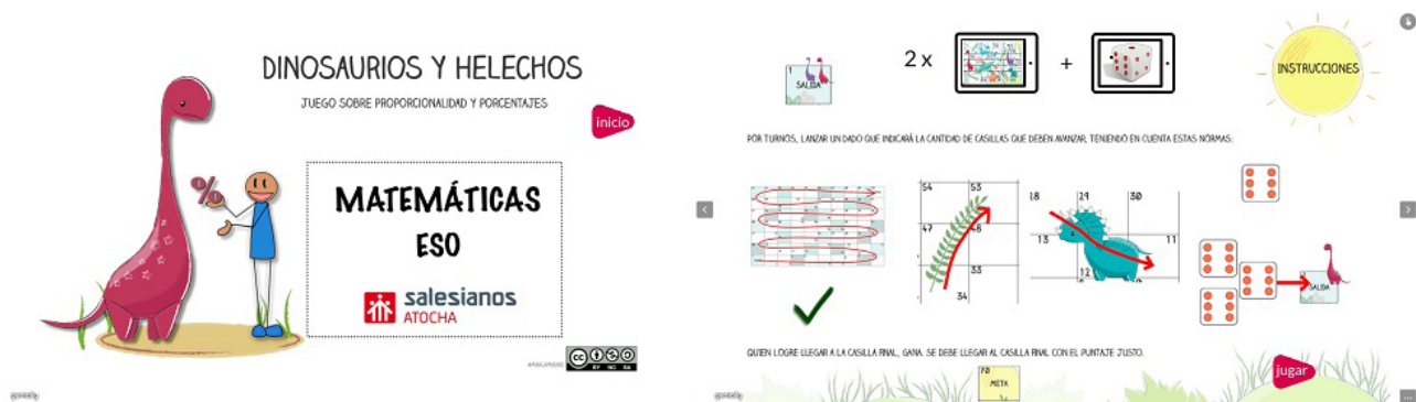
Imagen 4. Juego de matemáticas

Mi primera creación con Genially , sin embargo, no fue un libro interactivo, sino un juego de matemáticas.