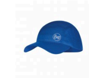
R-Solid Royal Blue Gorra One Touch 34,95€ 27.96€