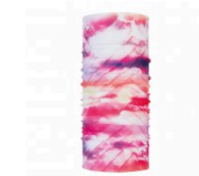
Ray Rose Pink Tubular Coolnet® UV+ 16.95€