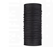
Ether Graphite Tubular Coolnet® UV+ 16.95€