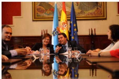
El alcalde de A Coruña, Carlos Negreira, y la conselleira de Sanidad, Rocio Mosquera, en la firma del convenio. Carlos Pardellas

EFE | A CORUÑA El alcalde de A Coruña, Carlos Negreira, y la conselleira de Sanidad, Rocio Mosquera, han firmado hoy un convenio de colaboración entre Urgencias Sanitarias de Galicia-061 y el Ayuntamiento para la implantación del programa Alerta Escolar en la red de escuelas infantiles municipales de la ciudad.