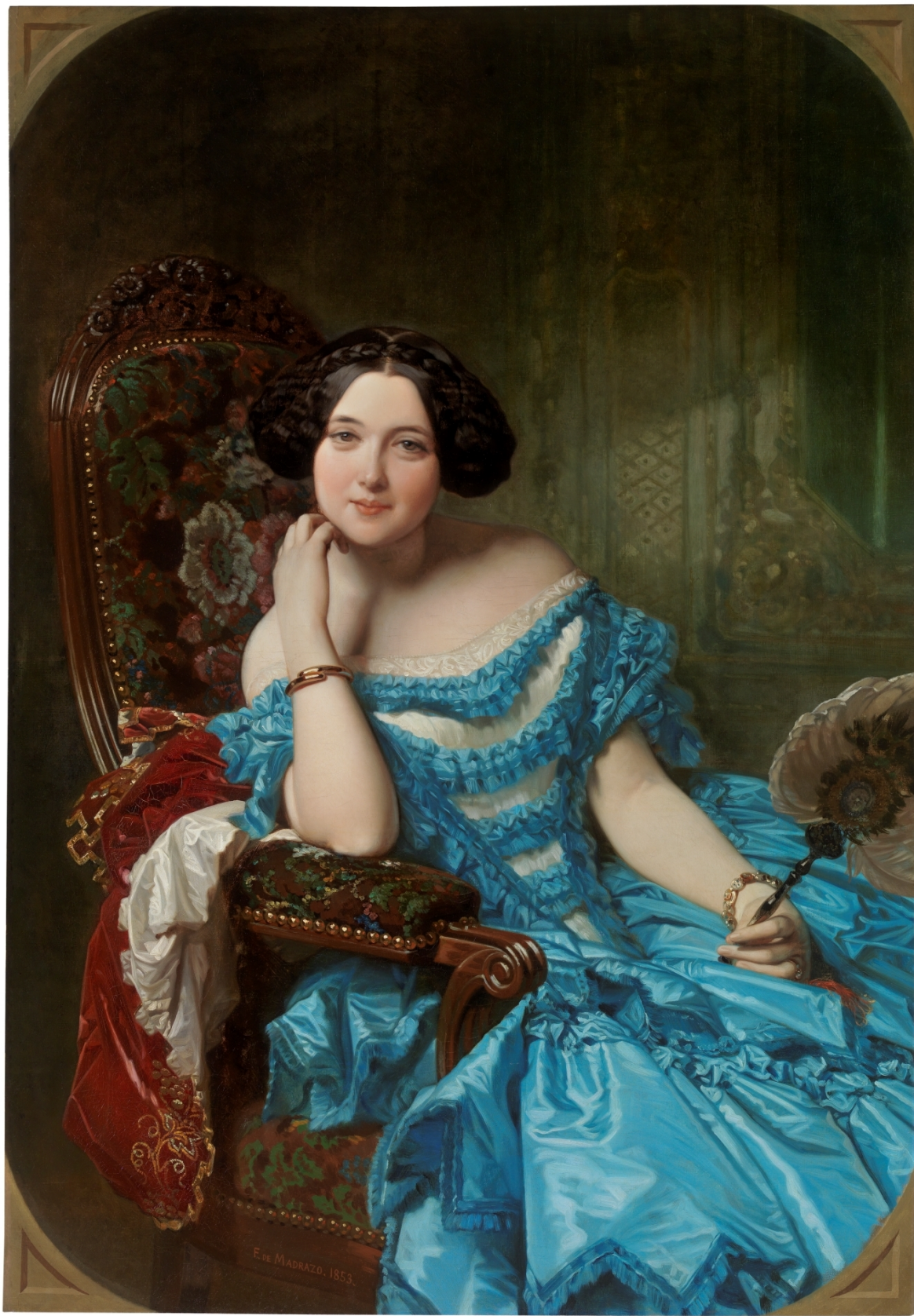
LA CONDESA DE VILCHES 1853- Federico de Madrazo