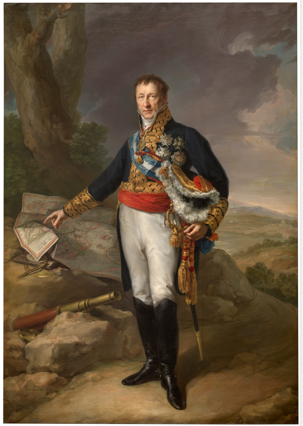
PEDRO ALCÁNTARA ÁLVAREZ DE TOLEDO 1827- Vicente López Portaña