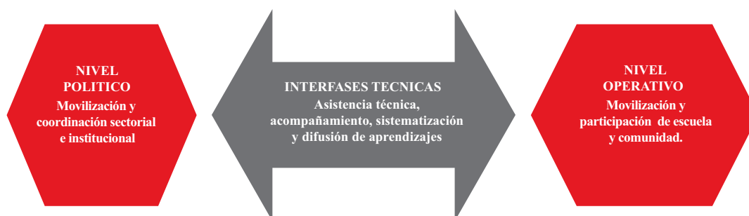
Figura I: Niveles e Interfases en el proceso de implementación

Entre estos dos niveles de implementación, es necesario plantear interfases técnicas, encargadas de movilizar la asistencia (conocimientos, habilidades, herramientas) y acompañamiento a las escuelas para facilitar y fortalecer la calidad de las intervenciones. Estas interfases técnicas incluyen acciones de capacitación, desarrollo de materiales, asesoría, investigación, monitoreo, evaluación y puesta en red de experiencias.