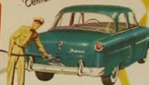
Exclusive Power Pilot Economy

"Only car in its field with 'Center-fill' fueling"