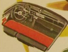
New Flight-Style Control Panel