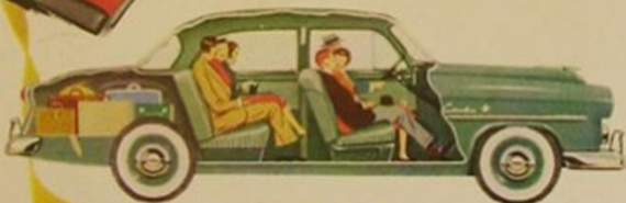
New Coachcraft Bodies