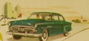
Automatic Ride Control