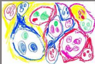
1º DIBUJO SAMUEL