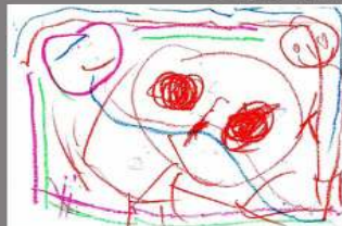
2º DIBUJO SAMUEL