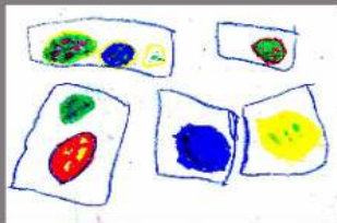
1º DIBUJO LEMMY