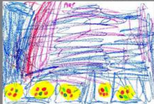
1º DIBUJO ARIADNA