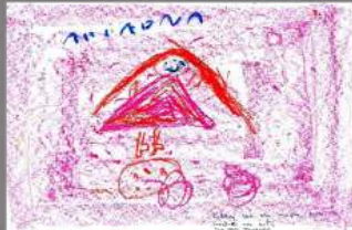
2º DIBUJO ARIADNA