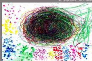
2º DIBUJO ICIAR