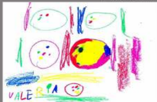
1º DIBUJO VALERIA