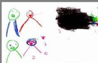
2º DIBUJO ARI