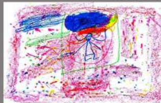
2º DIBUJO VALERIA