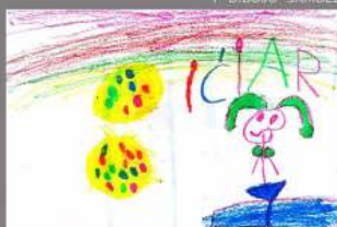
1º DIBUJO ICIAR