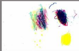
2º DIBUJO LEMMY