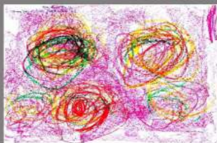
1º DIBUJO ARI