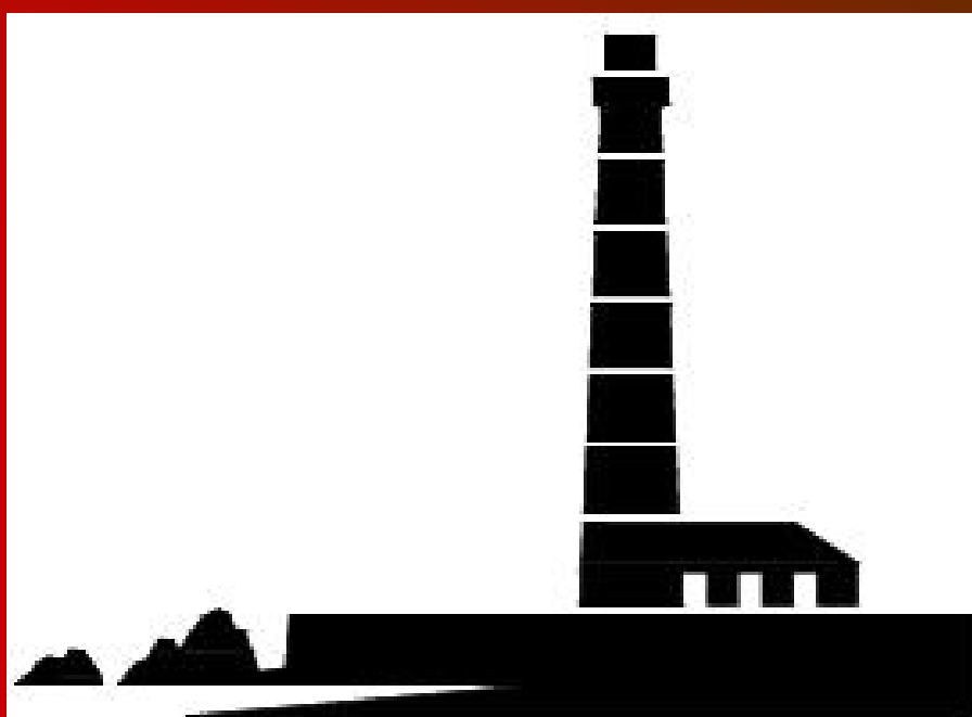
AGRUPAMENTO DE ESCOLAS ENG. FERNANDO PINTO DE OLIVEIRA