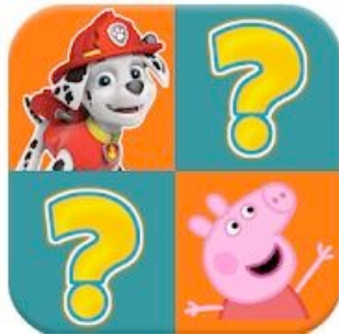
Juego de memoria para niños