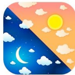
Aprender palabras opuestas