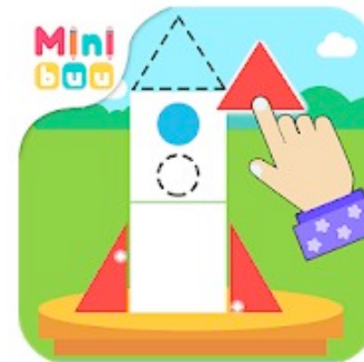
Formas y figuras