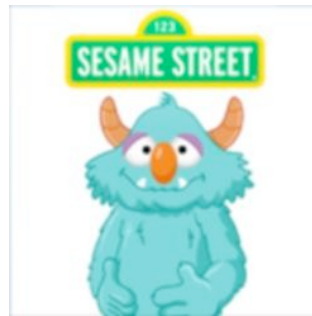
Respira, piensa, actúa