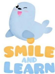
Smile and Learn