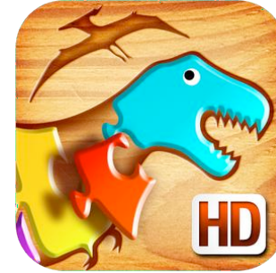
Mis primeros puzles