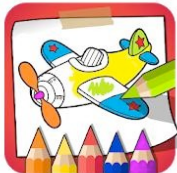
Colorear y pintar