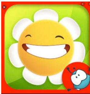
My Little Garden