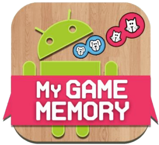
My Game memory