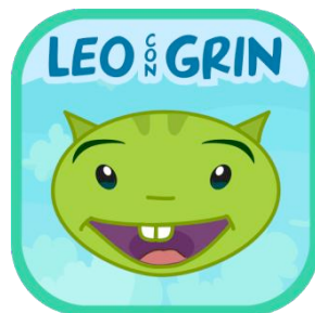
Leo con Grin