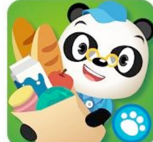
DR Panda El