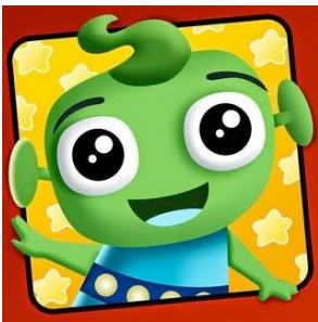
Hablando con NOK