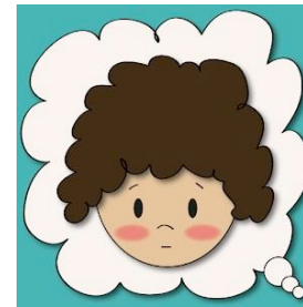
Teoría de la mente