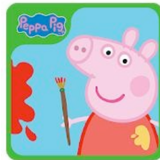
Colorear Pepa Pig