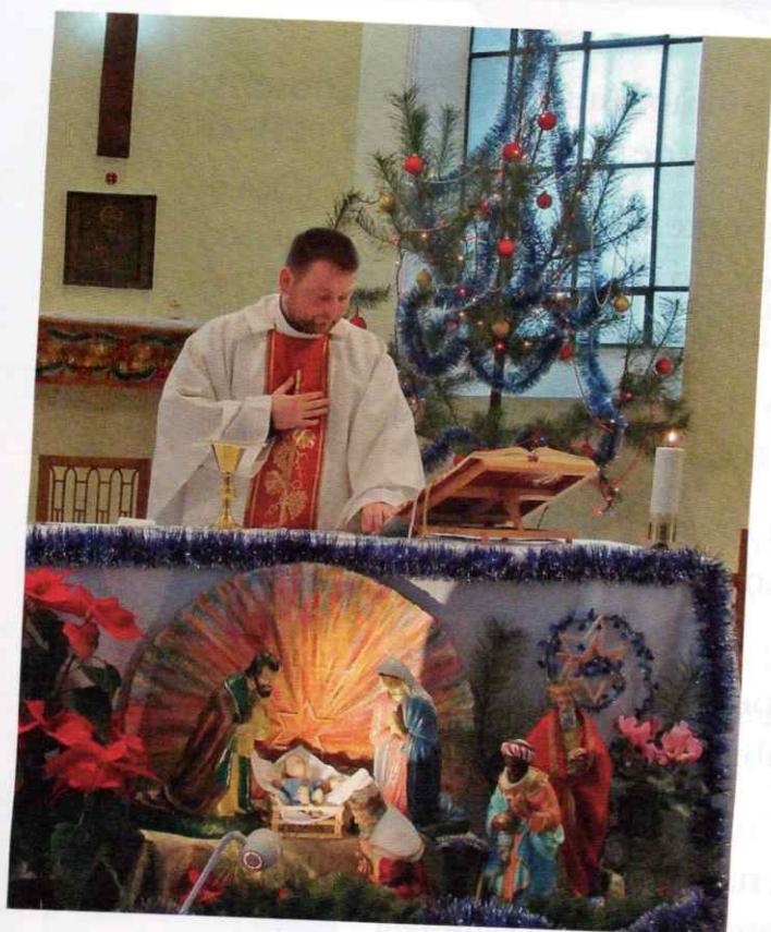
Celebración de la misa del Gallo.