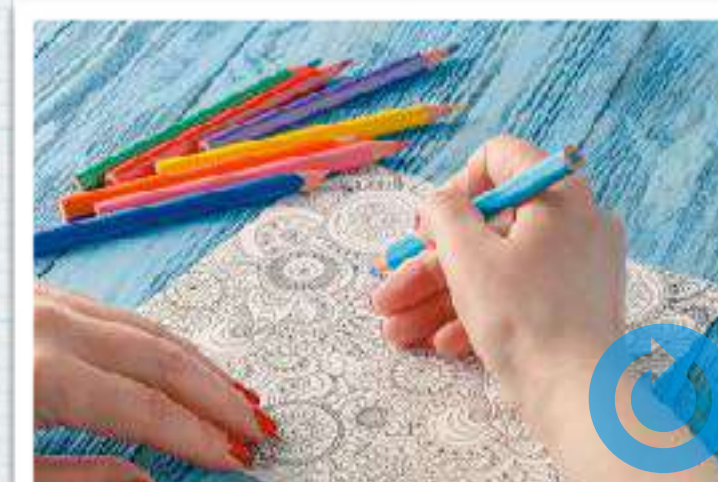
Rincón de la calma